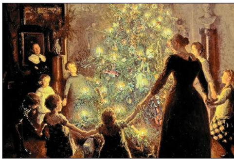
Az első karácsonyfa...