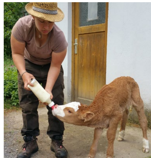
Az árva borjú megmentése Németországban

- A permakultúra-építő mesteremtől több mint egy év után elköltöztem a páromhoz. Most párkapcsolati vízummal vagyok itt. Ezzel a vízummal azt szeretnék elérni, hogy a helyiek ne menjenek a szerelmük után, hanem inkább együtt maradjanak helyben. A párkapcsolat valóságát közösen fizetett számlák bizonyítékával, fotókkal, Facebook bejegyzésekkel, beszélgetésekkel kellett igazolni. Néha kekeckedtek, úgyhogy kénytelen voltam egy kicsit intimebb beszélgetésünkről egy másolatot küldeni,