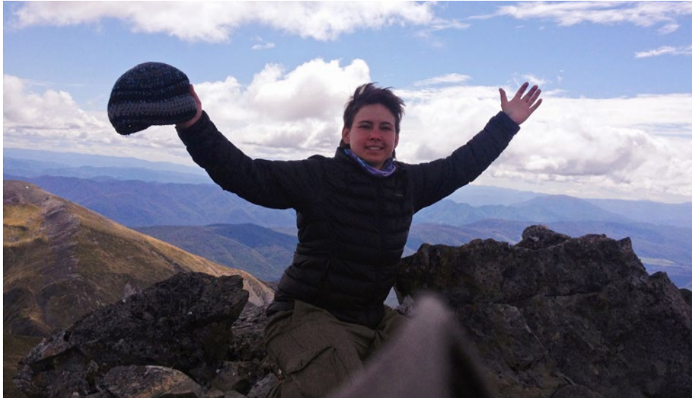
Angelus csúcán, Új-Zélandon

ogy haza akarok menni. Például Franciaországban a zöldségfarmon a tulajdonosok néha nagyon csúnyán beszéltek, kiabáltak az alkalmazottakkal. Én jeleztem, hogy velem ne beszéljenek így, sokáig tartották is magukat. Az első velem való kiabálás után eljöttem onnan.