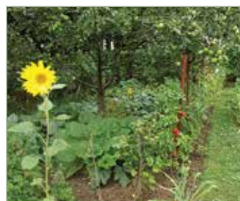
Doró Antal kertje