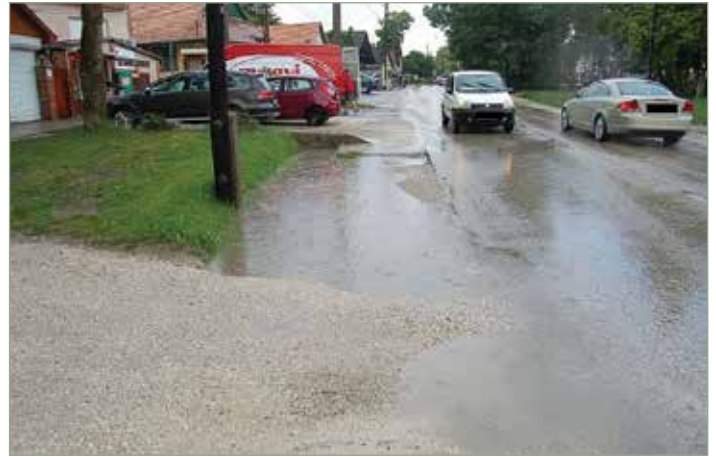
A Kossuth Lajos utca egy nagyobb esőzést követően

A fejlesztésre benyújtott, PM_CSAPVÍZGAZD_2018/7 azonosítóval rendelkező támogatási kérelmet a Pénzügyminisztérium 300 millió forinttal támogatja, amelyből összesen 2184 méter hosszúságban újul