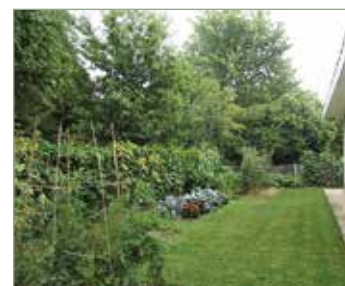
Monoki Péterné kertje