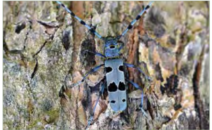
A havasi cincér hazánkban védett (eszmei értéke 50 000 Ft), a Természetvédelmi Világszövetség (IUCN) a sebezhető fajok közé sorolja

tette ezzel számos elhalt fa anyagát lebontó szervezet életesélyeit. Nagy kiterjedésű tarvágásokat, nagyobb kiterjedésű nyílt területekkel körbevett erdőfoltokat korlátozott rőpképességük miatt nem tudják benépesíteni. Az erdészeti ültetvények, ahol hiányoznak az idősebb tápnövényei szintén alkalmatlanok számára.