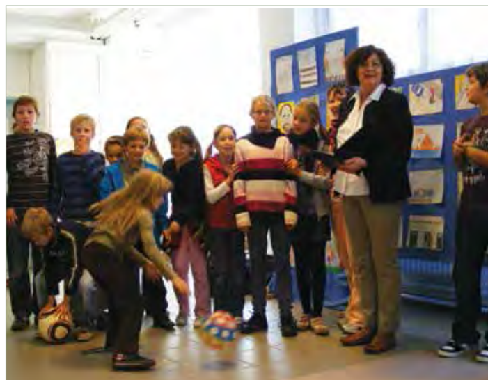
A mások tisztelete projekt keretében kiállításmegnyitó az Általános Iskolában a gyermekek rajzaiból 2010-ben