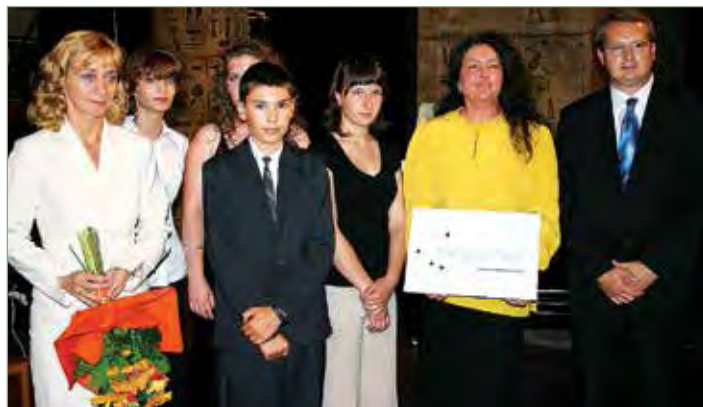
Koncert után a Madách Színházban a V4 Junior 2008 – Viva la musica nevű projekt keretében