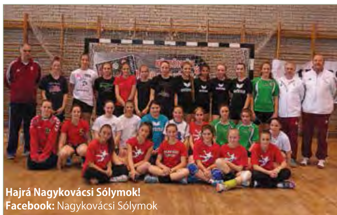
Hajrá Nagykovácsi Sóllymok! Facebook: Nagykovácsi Sóllymok

Kézilabda Szövetség által megrendezett Országos Serdülő területi válogatásán , (2002. január 1.-2003. december 31. között született leányok) ahol bizonyíthatták rátermettségüket, ezzel is megalapozva egyesületünk előmenetelét az elkövetkezendő bajnoki évre.