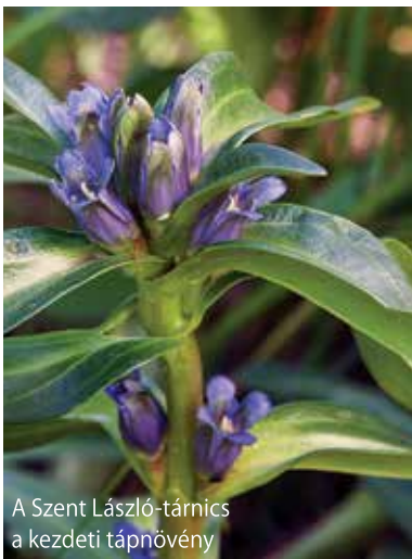
A Szent László-tárnics a kezdeti tápnövény

A kikelő hernyók néhány hétig a növényen maradnak és a magkezdeményekkel táplálkoznak. Ezt követően a talajra ereszkednek és megvárják, amíg bizonyos kétbütykös hangyafajok dolgozói megtalálják és adoptálják őket. Az adoptáció ebben az esetben azt jelenti, hogy a hangyák a fészükbe cipelik a hernyót, s a továbbiakban egy nagyra nőtt hangyalárvának tekintik. A megtévesztés azért lehet sikeres, mert valamennyi élőlény kültakarója az adott fajra jellemző kémiai összetételű. Esetünkben a hernyó bőrén lévő szénhidrátok összetétele nagyon hasonlít a hangyákéhoz, akiknek a kommunikációja főként érintés útján érzékelhető kémiai anyagokon alapszik. A fészekben azután a hangyaboglárka hernyók hangyalárvaként viselkednek, s így a dolgozók folyamatosan etetik őket, ezért is hívják őket „kakukk életmódú” fajoknak. Ez az életmód nagyfokú specializáltságot igényel és evolúciós szempontból nagyon fejlett. A hangyabog-