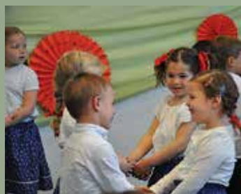
120 éves az Ovi