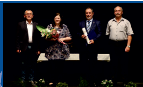
Az Év köztisztviselője cím átadása