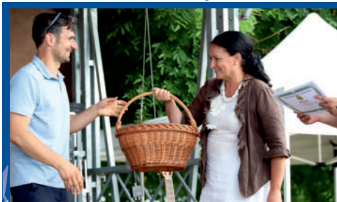
Vándorló Bográcsok találkozója