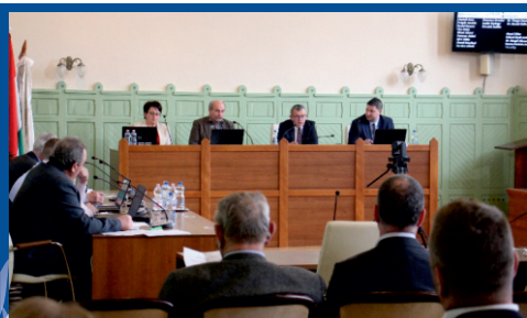
Testületi ülés mácuis 3-4. old.