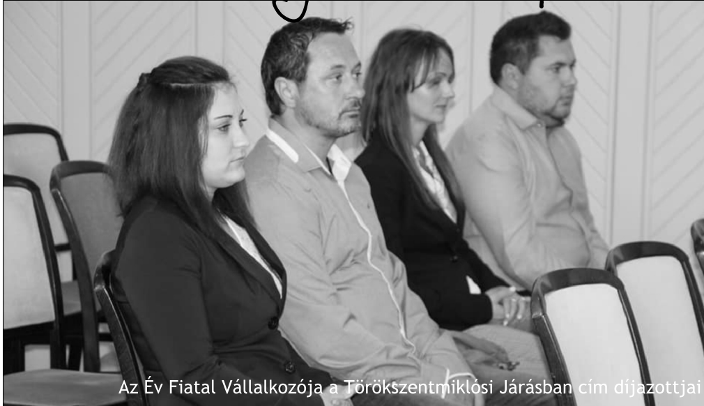
Az Év Fiatal Vállalkozója a Törökszentmiklósi Járásban cím díjazottjai

Törökszentmiklós Városi Önkormányzat és a Jász-Nagykun-Szolnok Megyei Kormányhivatal konzorcium keretében 310.420.000,- Ft összegben uniós támogatást nyert el a TOP-5.1.2-15 kódszámú, „Helyi foglalkoztatási együttműködések” című pályázati felhívásra benyújtásra került TOP-5.1.2-15-JN1-2016-00001 kódszámú, „Foglalkoztatási paktum megvalósítása a Törökszentmiklósi Járásban” című támogatási kérelme keretében. Az eredeti pályázati időszak 2019. december 31-ig tart, de most 9 hónap hosszabbítást kapott a folyamat.