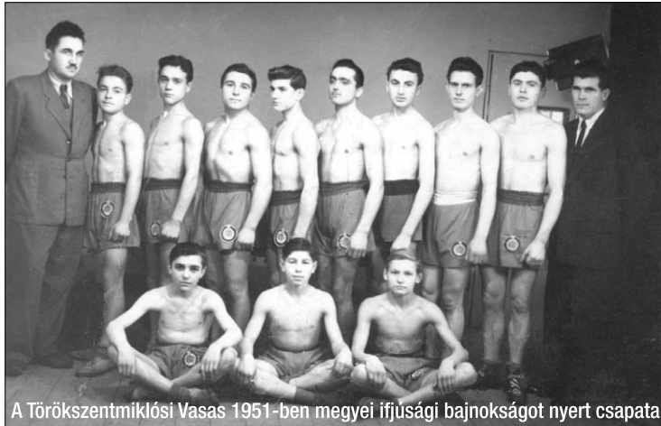
A Törökszentmiklósi Vasas 1951-ben megyei ifjúsági bajnokságot nyert csapata