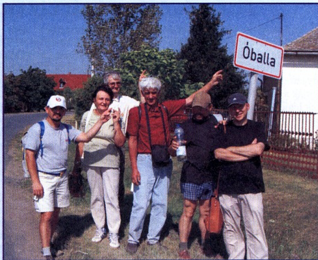
Az óballai El camino végállomása, avagy a gyalogos zarándokok a falutáblánál.