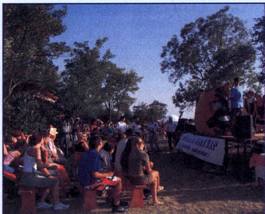
Egyetlen perc üresjárat sem volt a színpadon, a nézőtér mindig tele volt.