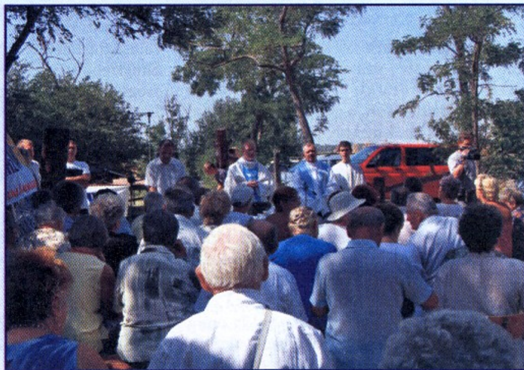
Az óballai búcsú alkalmával szentmisét is tartottak a faluban.