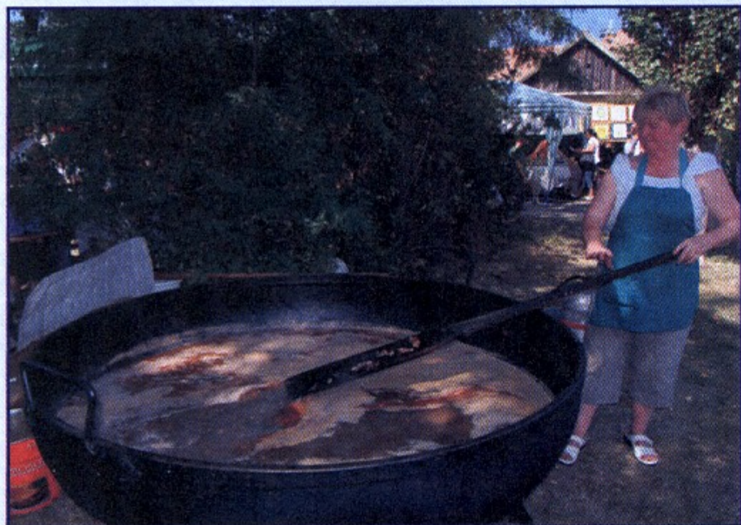
Senki nem maradt étlen-szomjan, ezer adag csülkös bableves főtt az óriáskondérban.