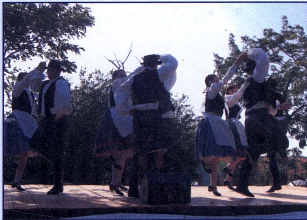
A Miklós Néptáncgyűttes ezúttal is fergetes produkciót mutatott be.