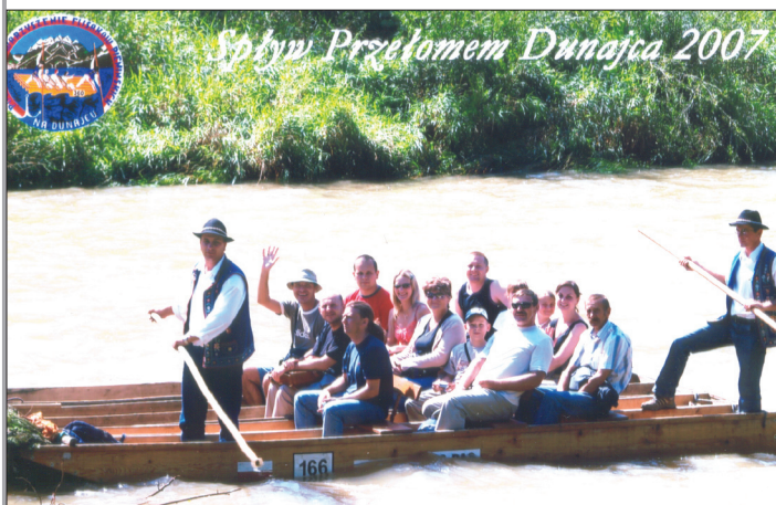
Képeslap egy nyári emlékről Olvasóinknak! A Hírlap szerkesztőségének delegációja felejthetetlen emlékként őrzi a lengyelországi, dunajeci tutajozást.