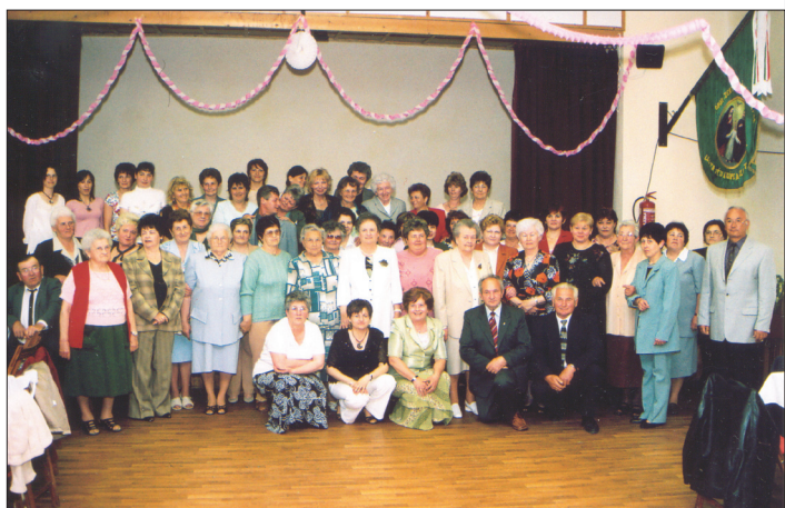
Újra együtt! Az 1995-ben megszűnt Házipari Szövetkezet egykori dolgozóit tizenkét év után találkoztak újra, egy vacsorán felidézve az együtt töltött esztendőket.