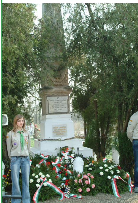
Cserkészek álltak díszőrséget a koszorúkkal borított Honvéd-síremléknél