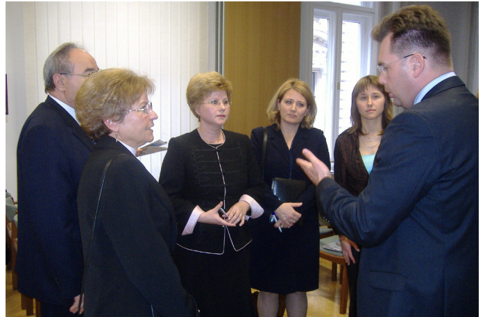
Az alapos előkészítő munka eredményeként sikeres volt városunk delegációjának bemutatója