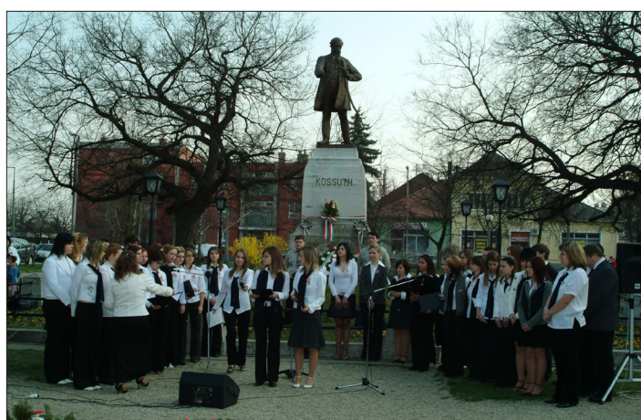
A Székács Elemér Szakközépiskola diákjai verses-zenés műsorral emlékeztek a szabadságharc hőseire a Kossuth-szobornál