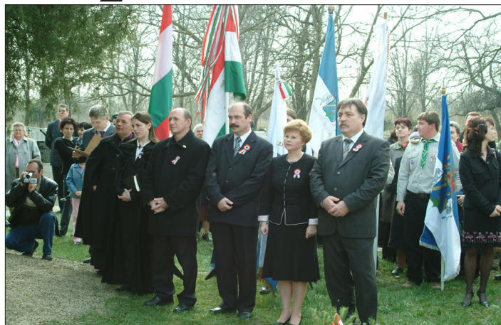
Egyházi, városi és megyei vezetőink a római katolikus temetőben lévő Honvéd-síremlék előtt hajtottak fejet