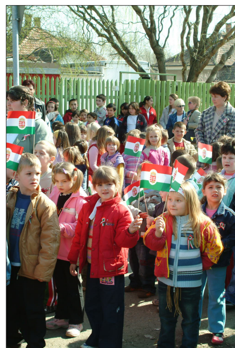
Március 15-e mindig is a fiatalok ünnepe