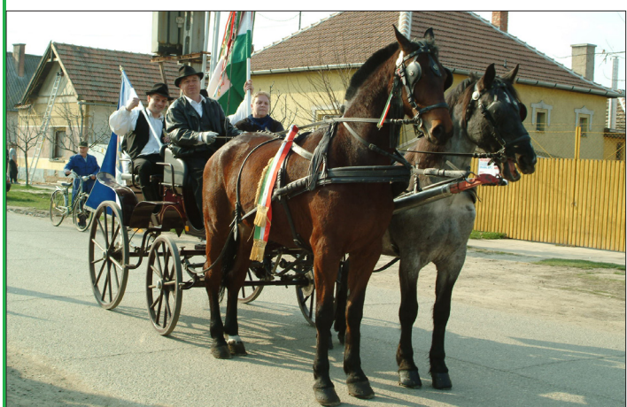
Volt aki hintóval vett részt az ünnepi menetben