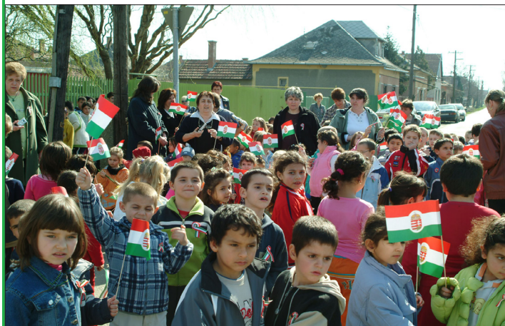
A Kossuth út 48 sz. háznál lévő Kossuth-emléktábla megkoszorúzásán az óvodások is ott voltak