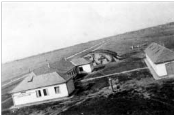
7. ÁBRA A SZENTESIEK EGYIK BÜSZKESÉGE, A PÍLÓTAOTTHON, BENNE HÁLÓKKAL, FÜRDŐVEL, MŰHELLYEL, GONDNOKI LAKÁSSAL, STB. A SZÁLLÁSHELYEN PING-PONG, SAKK, RÁDIÓ ÉS TÁRSASJÁTÉKOK TALÁLHATÓ. AZ ALAKULÓTÉR MÁSIK OLDALÁN AZ IRODA, A VENDÉGSZOBA, A 10-12 MÉTER HOSSZÚ GARÁZS, RAKTÁR, MŰHELY, AHOL A LEGNAGYOBB JAVÍTÁST IS EL LEHET VÉGEZNI. ANYAGHIÁNY MIAT KÖZEL HÁROM ÉVIG TARTOTT AZ ÉPÍTKEZÉS, ÍGY CSAK 1943 AUGUSZTUSÁRA KÉSZÜLHETETT EL.