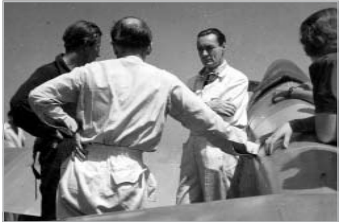
5. ÁBRA GRÓF KÁROLYI GYULA (SZEMBEN) AZ 1942. AUGUSZTUS 22-I SZENTESI LÁTOGATÁSA ALKALMÁVAL.

Gyula temetése szeptember 14-én volt Szenteshez közeli szülőfalujában, a nagymágocsi kegyúri templom kriptájában. (A Károlyi család volt Szentes utolsó kegyura 1837-ig. A szívélyes kapcsolat száz évvel később sem szűnt meg. Szentes város az örökváltság alóli szabadságát a repülés áldozatául lett gr. Károlyi Gyula nagyszüleitől vásárolta meg.) A temetés idején három Bücker Jungmann körözött a kastély és a falu fölött. A templomban a HMNRA egyenruhás repülőnövendékei álltak sorfalat a bejáratnál a ravatalig, közöttük a szentesi cserkészrepülők is v. Bogyay Kamill csendőr őrnagy vezetésével. A kormányzót és családját özvegy Horthy Istvánné képviselte.