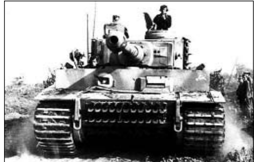
SZEMBŐL JÓL LÁTSZIK A TIGRIS I. FŐ EGYIK FŐ ERŐSSÉGE, A 8,8 CM-ES ÁGYÚ