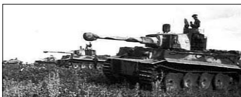
TIGRIS I. NEHÉZPÁNCÉLOS PIHENŐBEN

gedett 80 tiszt és 1367 fő a legénységből. 14 A Harctudósítás szerint elesett, eltűnt és fogságba esett 17 tiszt és 279 legénységi állományú, megsebesült ill. megbetegedett 62 tiszt és 1091 legénységi állományú személy. Az összvesztéséből 48 tiszt és 1022 legénység a 3. gépkocsizó lövészeszeregre esett, így a lövészszázadainak harcos létszáma 40-60 főre csökkent. 15 A VKF május 15.-i tájékoztatója szerint elesett és eltűnt 15 tiszt és 309 fő a legénységből, megsebesült 53 tiszt és 996 fő a legénységből, ám itt a betegeket nem említik. (A május 1-jei közlésében 61/1550-es összvesztéget említ, amiben talán a betegek is benne voltak, de a májusi veszteségek természetesen nem.) 16 Az eltérő adatokat összesítve elmondhatjuk, hogy kb. 80-100 tiszt és 1500 legénységi állományú honvéd volt a hadosztály teljes vesztesége az április-májusi harcok során.