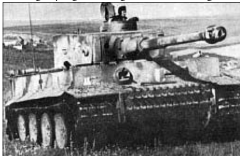
TIGRIS I. MENETBEN A KELETI HADSZÍNTÉREN. EZ A KÉP A NYUGATI FRONTON VALÓSZÍNŰLEG CSAK NEHEZEN KÉSZÜLT VOLNA EL, HISZ A SZÖVETSÉGES LÉGI-FÖLÉNY LEHETETLENNÉ TETT MINDEN NAPPALI MOZGÁST, KÜLÖNÖSEN NYÍLT TEREPEN.

A személyi veszteségek a Tapasztalati jelentés szerint: elesett és eltűnt 19 tiszt és 282 fő a legénységből, megsebesült ill. megbete-