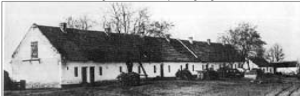
JANKAPUSZTAI CESELÉDLAKÁSOK AZ 1930-AS ÉVEKBEN

Ha egyetemeségben szemléljük a műfajt, akkor azt mondhatjuk, hogy a szociográfia a szociológiából hasadt ki. Ez a tétel fedi is a valóságot, ha a nyugat-európai országokra alkalmazzuk. Ott elmondhatták a szociográfusok, hogy tudományáguk többé nem a szociológia segédtudománya, hanem önálló műfaj. Magyarországon azonban nem beszélhetünk komoly elméleti szociológiáról, így a szociográfia kérdése elsősorban nem tudomány-rendszer-tani kérdésben merül fel. 1 Szociológiát, mint tudományt sokáig még a XX. században sem ok-