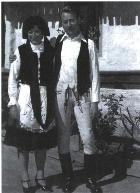
EGY LEHETSÉGES MAGYARÁZAT SZERINT A KÉPEN LÁTHATÓ CSÍKI NÉPVISELET JELLEGZETES FEKETE SZÍNE A MÁDÉFALVI VESZEDELEM GYÁSZÁRA EMLÉKEZTET

rásban lakik, de laknak a székely községekben is egyeseken, kiktől már csak vallásukban különböznek, nyelvük és viseletük azonos, a valamennyien kifogástalan hazafiak. A csekélyszámú örménység 1671 óta testvére a csíki székelységnek, amennyiben a szépvízi és gyergyószentmiklósi telepeikről kibocsátott rajok által napról napra érintkeznek vele; lobbanékony, heves, de kitartás nélküli faj. Eleme a kereskedés és ebben utolérhetetlenül jó. A zsidóság letelepedése csaknem mai keletű; inkább az Oláhországgal szomszédos településeket lepték meg és aszerint hullámanak innen és túl, amint a megélhetési viszonyok itt vagy ott kedvezőbbben” (Révai).