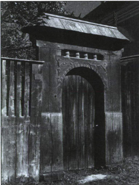
A JELLEGZETES ŐSI SZÉKELY KAPUSZERKEZET A ROMÁN STÍLUS JEGYEIVEL.

Pénzügyi szempontból Csík a székelyudvarhelyi pénzügyigazgatóság területének része. Adóhivatala és pénzügyőri bizottsága Csíkszeredán és Gyergyószentmiklóson, mellékvámhivatala Csíkgyimesen, Gyergyóbékáson és Gyergyótölgyesen van. Ipari és kereskedelmi ügyeit illetőleg a marosvásárhelyi kamara kerületéhez van beosztva. Államépítészeti hivatala Csíkszeredán van, a közutak tekintetében a brassói felügyelői kerület, posta- és táviróügyekben a kolozsvári igazgatóság hatáskörébe tartozik.