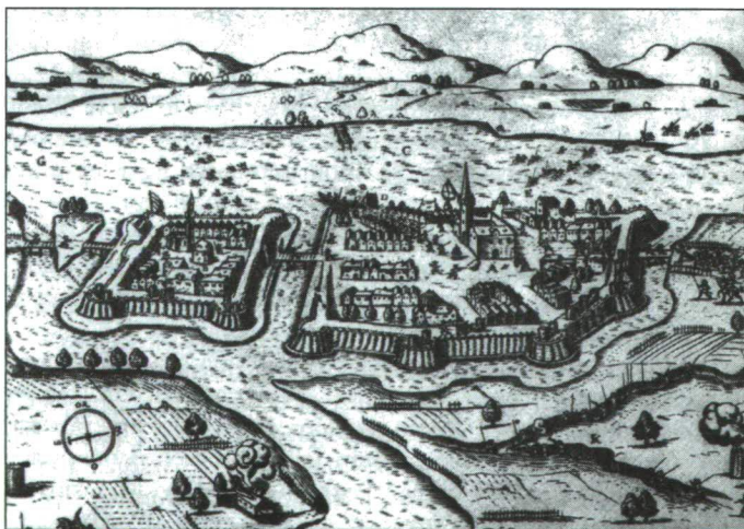
3. ábra A SZOLNOKI VÁR A TÖRÖK KORSZAKBAN

Szeptember végén a kurucok elfoglalják a várat, Rákóczi generalátus székhelyévé teszi. Nagyszabású erődítési munkák indultak, amelynek állapotát Károlyi Sándor 1705. október 4-én