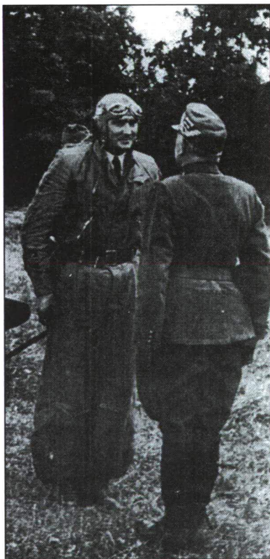
HORTHY ISTVÁN TARTALÉKOS VADÁSZ- REPÜLŐ TISZT A KELETI FRONTON

A repülés alapjainak megismerése, az egyedül repülésre jogosító vizsga után Szegeden (1927, majd 1928 nyarán) folytatta kiképzését a későbbi kormányzóhelyettes. Előre kell bocsájtanom, hogy nem élvezett semmilyen kedvezményt azért, mert az ország kormányzójának gyermeke volt. Sem Szombathelyen, sem Szegeden nem a szalontiszi képzést forszírozták. Vitéz Hári László parancsnok, közismerten a Tata, híres volt következetes szí-