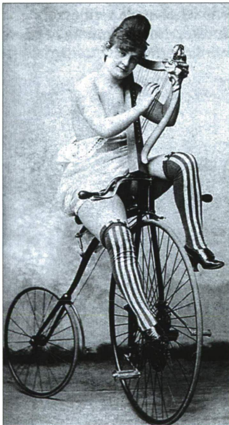
A MODERN NIMFA