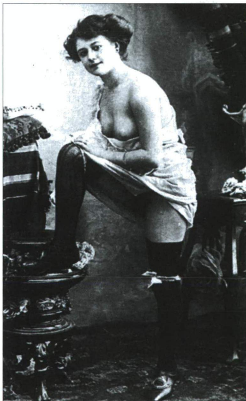
EGY „ÁRUCIKK” AZ EGYIK NYILVÁNOSHÁZ KÉPKATALÓGUSÁBÓL

A harmadik fontos vonás a szabályozásokban a 90-es évek során, hogy lassan elfogadottá válik a bordélybeli mulatozás (hallgatólagosan korábban is engedélyezett volt, ám konkrétan ekkor mondják ki) immáron a