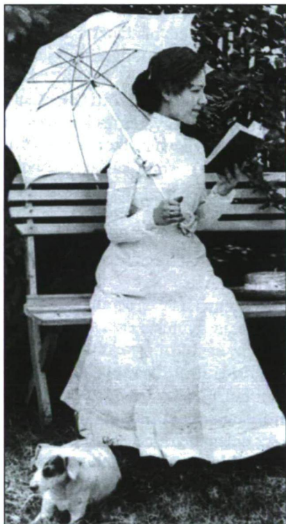
A XIX. SZÁZAD POLGÁRI ÉRTÉKRENDJÉNEK NŐIDEÁLJAI: FIATAL LÁNY, AHOGY ILLIK...