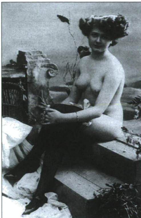
EZÚTTAL ÁRENGEDMÉNY NÉLKÜL

képzelné, hogy a prostitúció Kecskeméten megtört negatívumból szívesen látott vendég lett, sőt itt is megpróbálták elrejtetni: „a bordély a kevésbé járt félreeső utcákra szorítottassék, a városban lehetőleg szétosztassék és végre, hogy a bordélyhelyiségek úgy elhelyezésüknél, mint építésmódjuk és berendezésüknél fogva a közszemérem és közegészség követelményeinek megfeleljenek.” 50