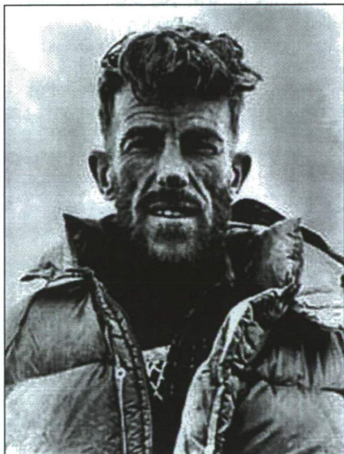
SIR EDMUND PERCIVAL HILLARY K. B. E.