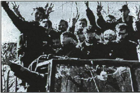
4. ábra SZERB ÖNKÉNTESEK FOGLYOKAT SZÁLLÍTANAK