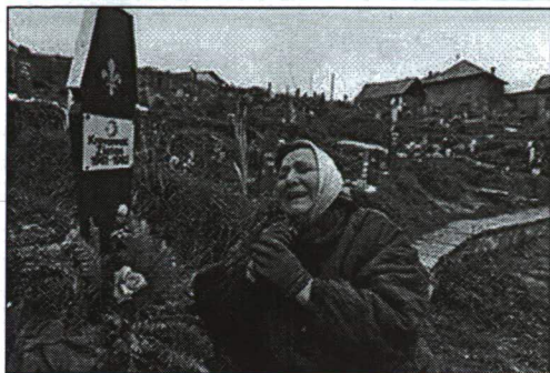
7. ábra MUZULMÁN ASSZONY AZ ELESETT FIA SÍRJÁNÁL