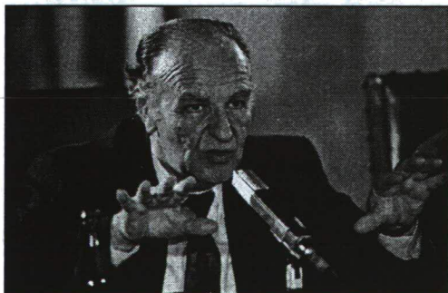
1. ábra ALIJA IZETBEGOVIĆ, BOSZNIÁ-HERCEGOVINA ELNÖKE