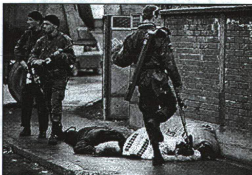
2. ábra A SZERB SZABADCSAPATOK A LAKOSSÁGOT BANTALMAZZÁK BJELINÁBAN