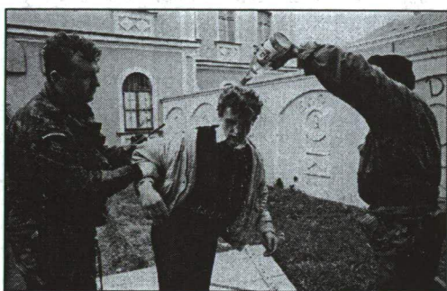
10. ábra ARKAN KATONÁI EGY FIATAL MUZULMÁN FÉRFIT BÁNTALMAZNAK BÁNTALMAZNAK BJELINÁBAN, 1992-BEN