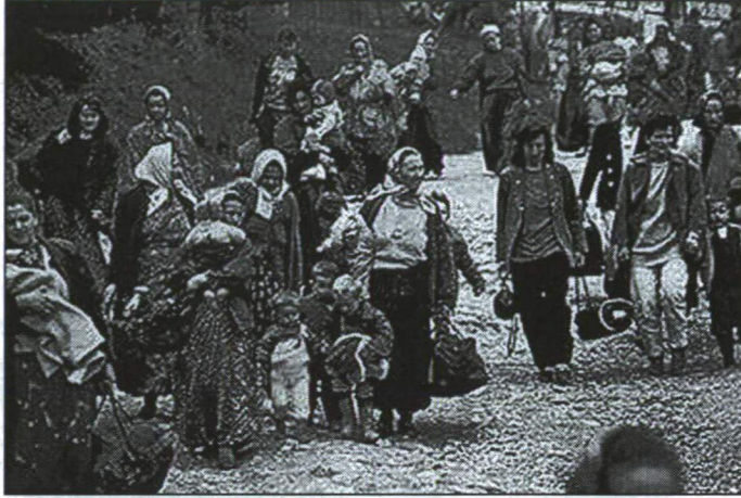
3. ábra AZ ETNIKAI TISZTOGATÁS KEZDETE