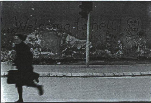
5. ábra SZARAJEVÓ, 1992