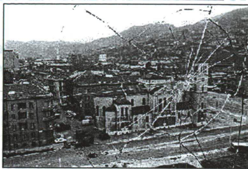
8. ábra SZARAJEVÓ, 1993