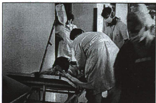
9. ábra SZÜKSÉGHÓRHÁZ AZ OSTRÓMLOTT SZARAJEVÓBAN