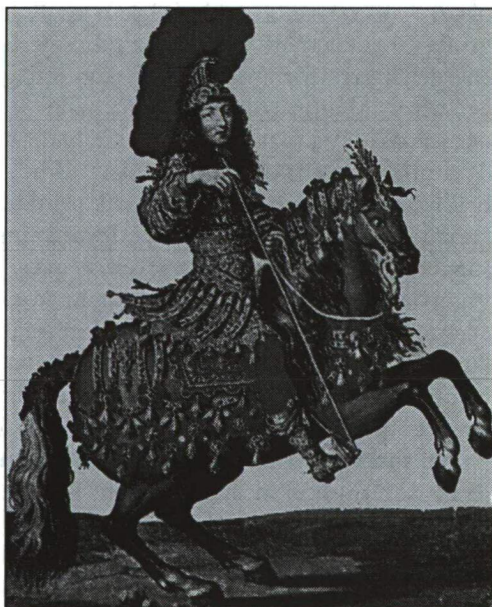
XIV. LAJOS FRANCIA KIRÁLY ÓKORI CSÁSZÁRI DÍSZBEN

A francia megoldás persze nem volt örökéletű. A XVII. század elején a francia kormányzat egyetlen előnye az volt, hogy megszabadult terhei egy részétől: kevésbé terhelték adósságok, mint a spanyolokat, akik a múlt öröksége alatt nyögtek. Az idő előrehaladtával azonban a régi teher visszatért. XIV. Lajos uralmának végét a hivatalok és egyházi javadalmak számának növekedése jellemezte. A cél egyértelműen a hivatalok kiárusítása volt. A háborús nyomás már a korai években hasonló következményekkel járt. Spanyolországhoz hasonlóan Franciaországban is újra és újra felmerült a hivatalok kiárusíthatóságának kérdése: a teljes eltörlés és a reform merült fel megoldásként; a kormányzat a reform mellett döntött minden alkalommal, de végül a francia monarchia, a spanyolokhoz hasonlóan, a háború tényével volt kénytelen szembesülni. Tervek megvalósítását kényszerűségből elhalasztották, és a reformok helyett a régi rendszert erősítették meg. 25 Richelieu volt az első, aki Olivarest követve megpróbálta kombinálni a háborút és a reformokat, de a végén – és ebben is Olivareshez hasonló, – feláldozta a reformokat a háború oltárán. Marillac épp az ellenkezőjét tette volna. 26 A XVII. század végére XIV. Lajos haszontalan hivatalok felállításával és kiárusításával fedezte háborúi költségeit. A század elején azonban egészen más volt a helyzet.