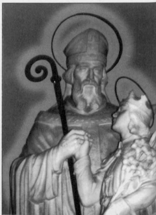
SZENT GELLÉRT VÉRTANUSÁGÁNAK 950. ÉVFORDULÓJÁN