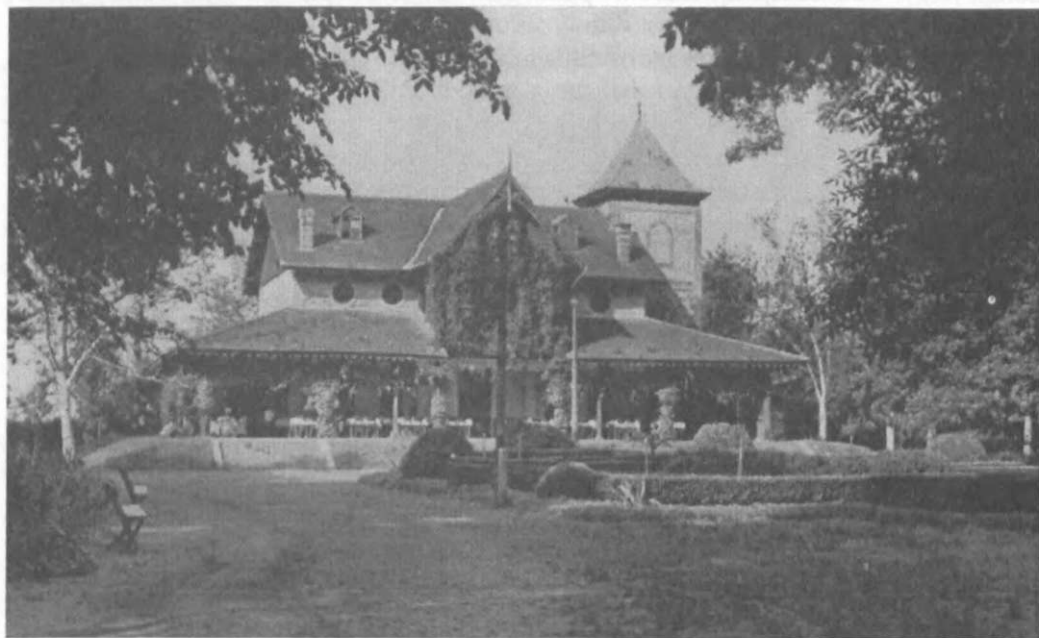
A MILLENNIUMI ÜNNEPEKRE ÉPÍTETT VIGADÓ LÁTKÉPE

Látni fogjuk, hogy hasonló jellegű engedmények a részvénytársaságot többször is megilletnék, azonban ezek valójában sohasem lépnek életbe.