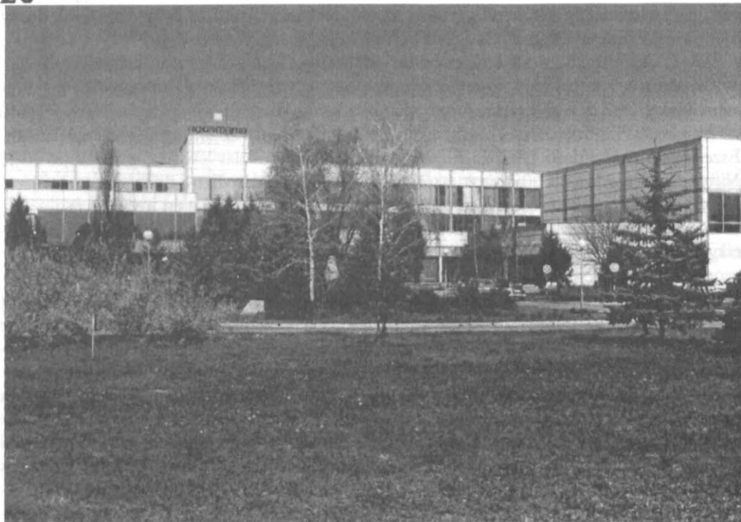
A KANIZSAI „BANJA” GYÓGY- ÉS ÜDÜLŐKÖZPONT (AQUAMARIN)