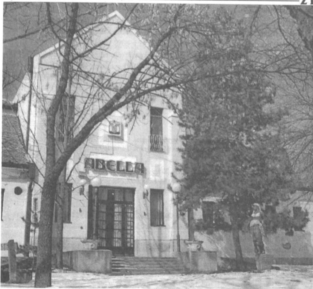
AZ 1985-BEN ÁTALAKÍTOTT RÉGI FÜRDŐ ÉPÜLETE (ABELLA)