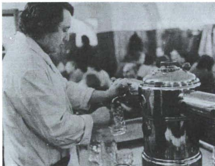
Egy korsó csapolt Pilsner Urquell valóban lágy és frissítő