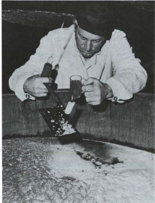
A sörmesterek rendszeresen ellenőrzik a sör alakulását a hagyományos fa erjesztőkádakban

Csehország közel 1000 éves sörfőzési tradíciókkal rendelkezik. A vyšehradi káptalan alapítólevele 1088-ból származik, ez a cseh sörfőzés első írásos dokumentuma. Már 859-ben termesztették a komlót, sőt 1001-ben Hamburgba exportálták is. A prágai Vyšehrad-templom alapító okiratában