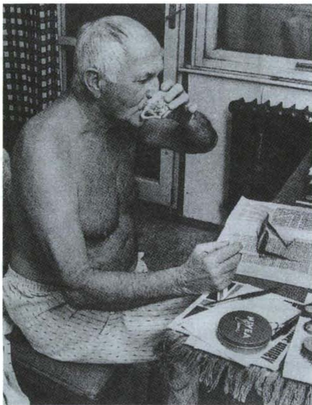
Ma remekmű születik