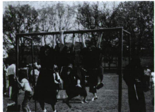
A Belvedere szerkesztőinek tornagyakorlata (A felvételek az 1992 áprilisában megrendezett Tatárjárás-konferencián készültek.)