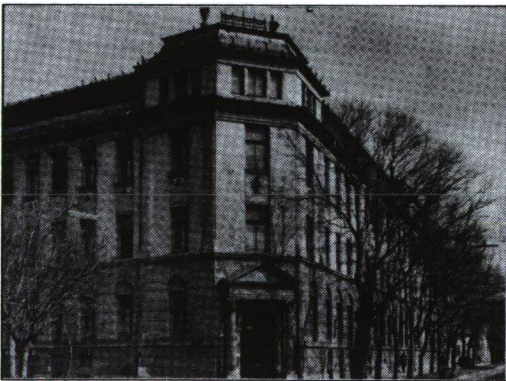
A főiskolának, a háború után, az apácáktól örökölt és az utóbbi években azoknak visszaadott „B” épülete