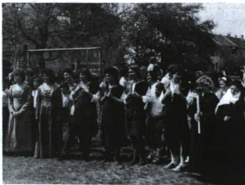
Apácák, lovagok, udvarhölgyek