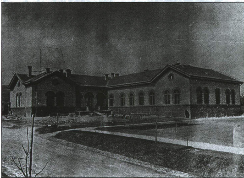
A Pedagógium (ma: Testnevelési Egyetem) épülete Budán

2. 1928-ig nem egy Főiskola történetét kell vizsgálnunk, hanem kettőét: a Polgári Iskolai Tanárképző Intézetét és a Polgári Iskolai Tanárképző Intézetét. Neveléstörténeti pontatlanság – és igazságtalanság –, hogy általában megfeledkezünk a Polgári Iskolai Tanárképző Intézet történetéről, jóllehet ugyanolyan önálló intézet volt – külön tanári karral, épülettel, tantervvel stb. – mint