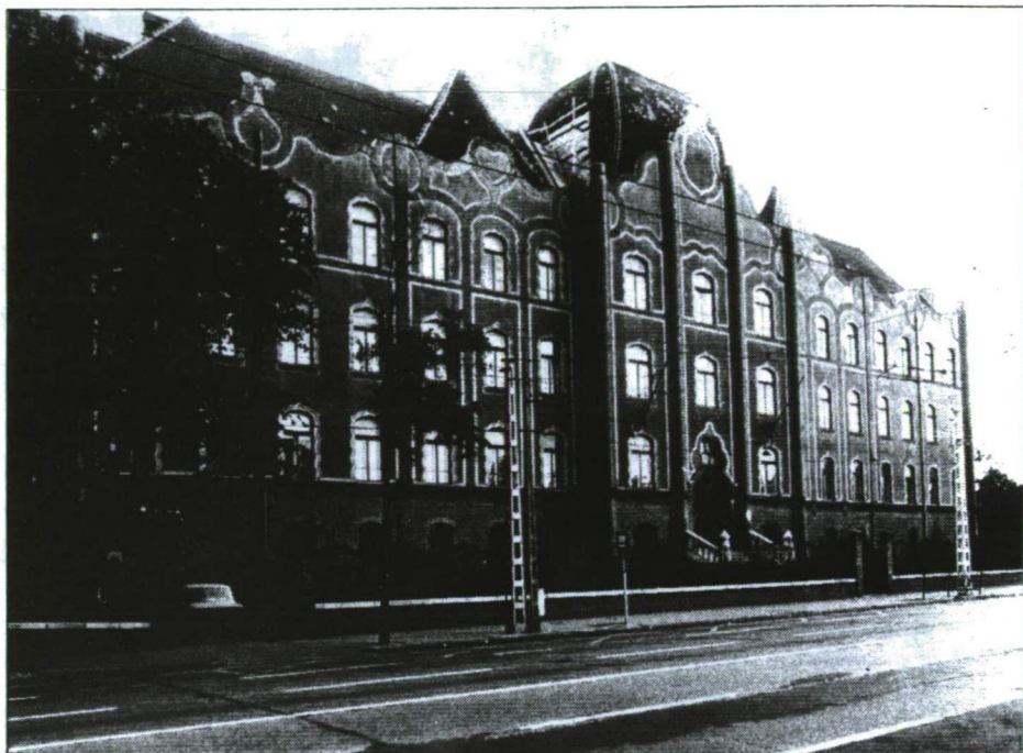
Az Erzsébet Nőiiskola (ma: Teleki Blanka Gimnázium) épülete

3. Mind a két tanárképző intézet 1928-ig beletartozott egy iskolakomplexumba: a Polgári Iskolai Tanárképző Intézetet az Erzsébet Nőiiskolába – az elnevezést 1898-ban vette fel, a meggyilkolt Erzsébet királyné emlékére, aki budapesti tartózkodásai alkalmával többször is felkereste az Intézetet –, amely magában foglalta a Polgári Iskolai Tanárképző Intézet mellett a gyakorló polgári iskolát, valamint az elemi iskolai tanítónőképzőt is. A Polgári Iskolai Tanárképző Intézet pedig a Paedagogium része volt. Az elnevezést – német mintára – az Intézet első igazgatója, Gyertyánffy István (1834–1930) adta az általa vezetett iskola-egységnek, amely az 1868. XXXVIII. tc. valamennyi iskolatípusát felölelte, tehát az elemi iskolát, a polgári iskolát, a tanítóképző-intézetet, a polgári iskolai tanárképzőintézetet, majd a tanítóképzőintézetű tanárképzőt is.