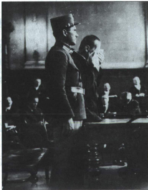
Matuska zokog a tárgyalóteremben