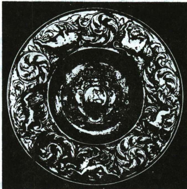
Aranyozott ezüst díztál – Danzig. (XVII. század)

A szalonból továbblépve a nappaliba érünk, melyet nagyrészt XIX. század végi bútortartás díszít. Ennél korábban, a francia forradalom korára datálható az a varrószekrényke , melyből gombnyomásra a Marseilles dallama csendül fel, és a kor szokásának megfelelően - természetesen - titkos fiókot is rejt magában. Nagy érdeklődésre tarthat számot a pipatórium , és egy üvegszekrényke, melyben XV-XIX. századi ötvösmunkák láthatók.