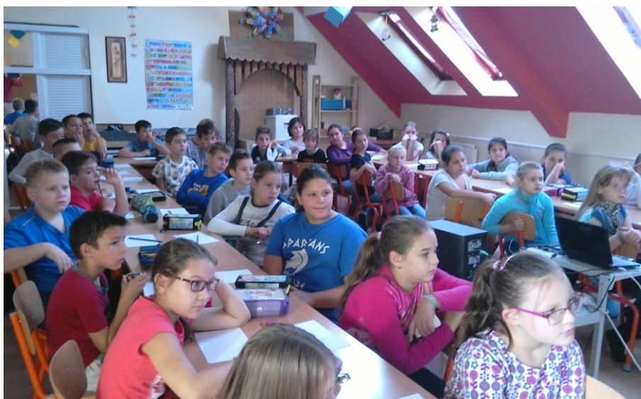
A 4. ÉS 5. OSZTÁLYOSAINK A FOGLALKOZÁS ALATT