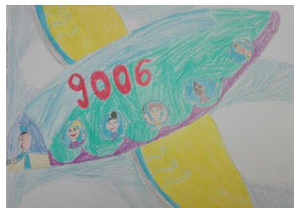
Utazzunk sok-sok országba! - Szűcs Netti