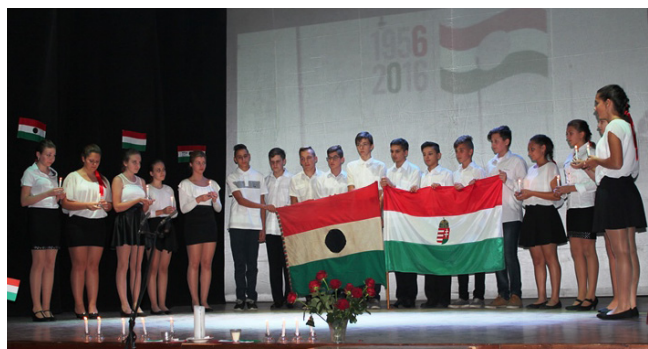
A NYOLCADIK OSZTÁLYOSOK MŰSORA