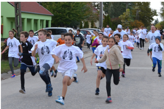
FUTÁS, PIHENÉS, DIJKIOSZTÁS