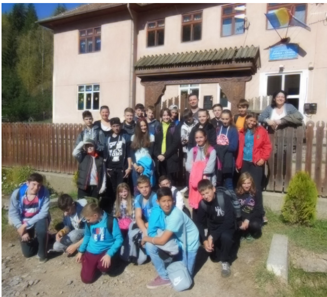
AZ OROTVAI TESTVÉRISKOLA ELŐTT