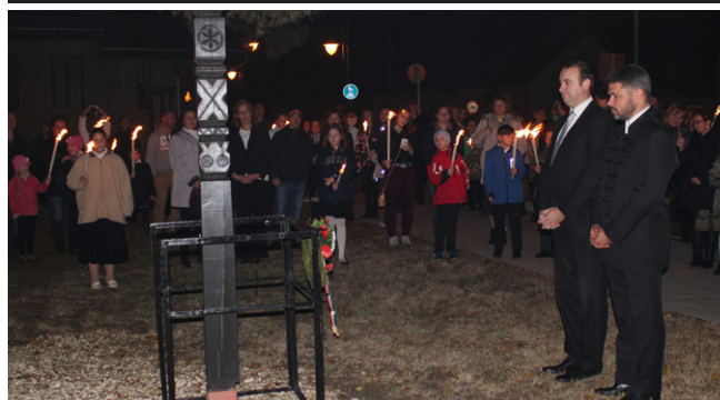
KOSZORÚZÁS A TEMPLOMKERTBEN