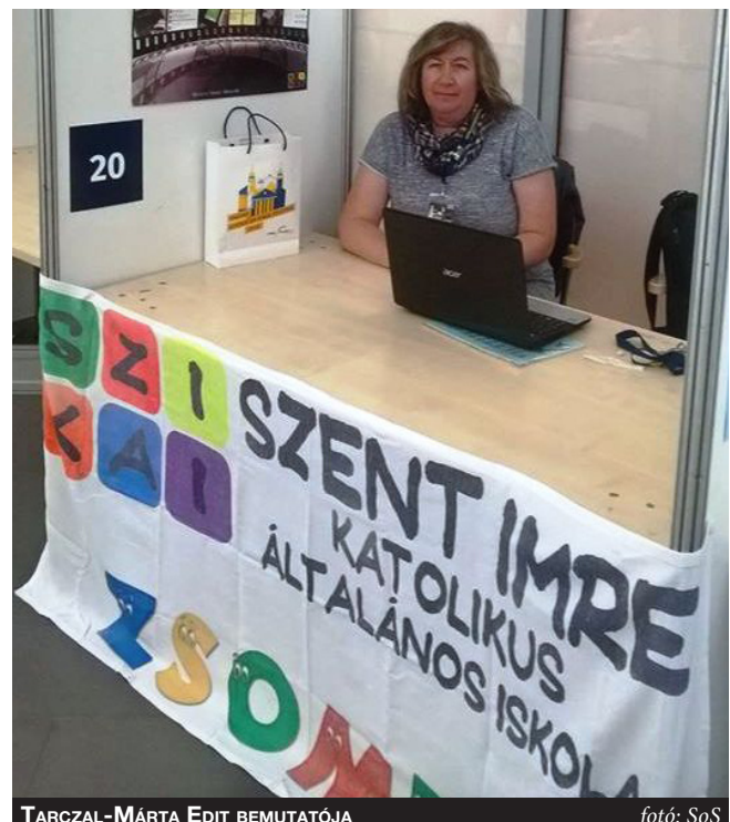
TARCSAL-MÁRTA EDIT BEMUTATÓJA

A fesztiválokon résztvevő tanárok a tanítási órán vagy a tanórán kívüli tevékenységben felhasználható innovatív és kreatív eszközöket, technikákat és témafeldolgozásokat ismertetnek. A fesztiválon kiállítókat egy előzsűrizés során választják ki.