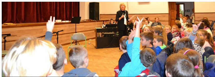
A VÁLASZ: PENTATON, EZ NEM KÉRDÉS