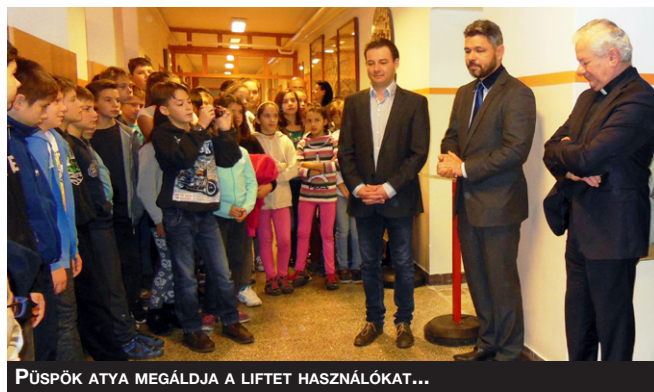
PÜSPÖK ATYA MEGÁLDJA A LIFTET HASZNÁLÓKAT...