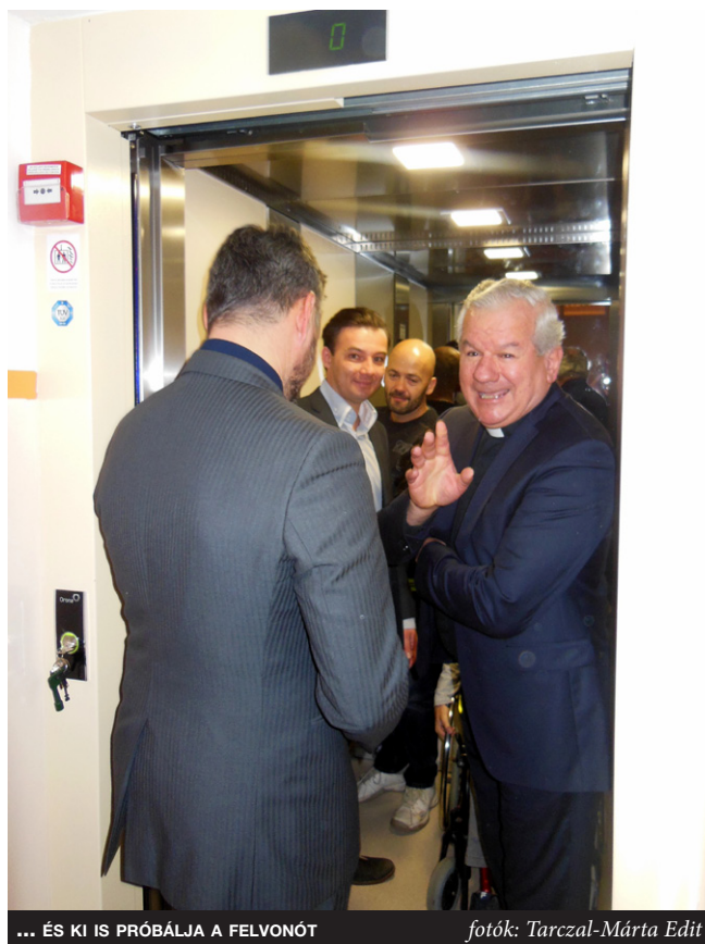
... ÉS KI IS PRÓBÁLJA A FELVONÓT