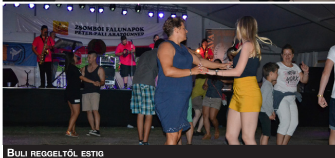
BULI REGGELTŐL ESTIG