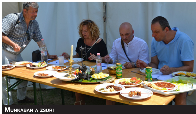
MUNKÁBAN A ZSÚRI

Az előző este felfrissült levegő szombat reggelre újra forróvá vált, de ez nem akadályozta meg a zenészeket abban, hogy síppal-dobbal ébresszék a falu népét reggel 7-kor. Szükség is volt a korán kelésre, hiszen ezen a napon is rengeteg program várta a sportpályára érkezőket: a főzőverseny résztvevői például már 8 óra előtt szorkoskodni kezdtek, hogy időben elkészüljön az ebéd. Idén rendhagyó, ám remélhetőleg hagyományteremtő módon nemcsak pörkölttel, hanem bármilyen helyben elkészített étellel be lehetett nevezni a versenyre szárnyas-, sertés- és marhahús kategóriákban. A versenyző csapatok rugalmasan vették az újítást, és igen kreatív ötletekkel nehezítették meg a zsűri dolgát: a pörkölt mellett készült eredeti mexikói csilis bab, rozsmaringos csirke, saslik, sőt még halpaprikás is.