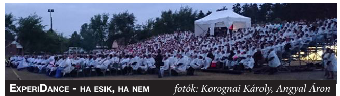
EXPERIDANCE - HA ESİK, HA NEM