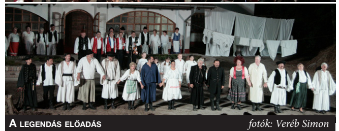
A LEGENDÁS ELŐADÁS