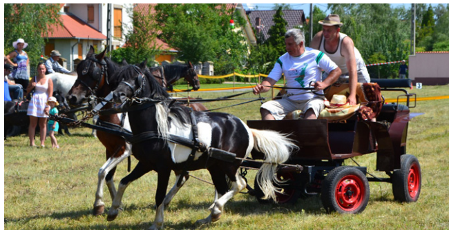
A FOGATHAJTÓ VERSENYEN