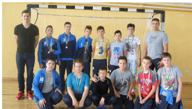
A KÉT BARTÓKKAL