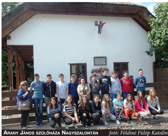
ARANY JÁNOS SZÜLŐHÁZA NAGYSZALONJÁN