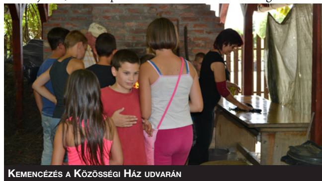
KEMENCÉZÉS A KÖZÖSSÉGI HÁZ UDVARÁN

foglalkozásokról szólt, a gyermekek három különböző kézműves programon tehették próbára kreativitásukat és kez ügyességüket. A zombói és máriaföldi gyerekek számára egyaránt érdekességet jelentett, hogy kipróbálhatták a korongozás ősi mesterességét, lapmajszoló szörnyecskét készíthettek könyvjelző gyanánt, és papírtányért dekorálhattak. A következő nap fő feladata a közös sütés volt. Csütörtökön a reggeli közös játék után elkészítettük az édes és a sós kalács, valamint a kenyérlángos tésztáját, amit a gyerekek közösen gyúrtak meg. Miután türelemesen kivárták, hogy megkeljenek a tészták, a gyerekek szebbnél szebb csigákat és fonott kalácsokat készítettek, és felhelyezték a kenyérlángos tésztájára a feltétet, majd közösen átvonultunk a József Attila Közösségi Ház udvarán lévő Falu kemencéjéhez, ahol szépen sorban kiszültek a finomságok. Ezután