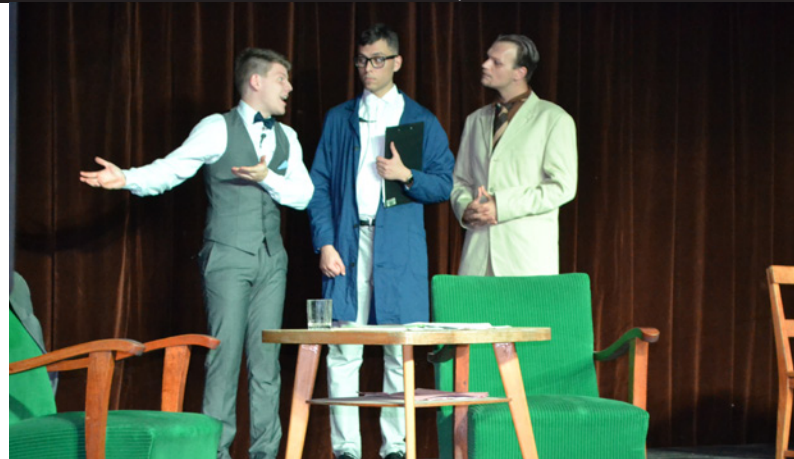
ZSOMBÓI SZABADTÉRI SZÍNPAD - AZ IBOLYA