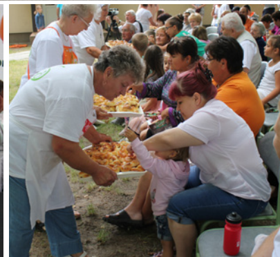
FALUNAP 2015 - ÉLETKÉPEK