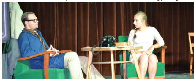
AZ IGAZGATÓ ÉS ILONKA

A Zsombói Szabadtéri Színpad 2015-ös évada egy vidám Molnár Ferenc-darabbal és egy lelkes pesti társulattal nyitott meg. A Tükör-Kép Társulat 2014 őszén alakult Budapesten színházkedvelő és -művelő fiatalok részvételével. Az első komoly megmérettetésük volt ez a darab, és – bár akadályokból nem volt hiány – abszolút sikerre vitték a feladatot. Az Ibolya teltházas pesti premierje után a zsombói közönség sem maradt szegényben, a hatalmas hőség ellenére igen sokan választották a légkondicionálás nélküli piacteret a hűs otthonok helyett – és azt hiszem, mindannyiuk nevében mondhatom, hogy megértte.