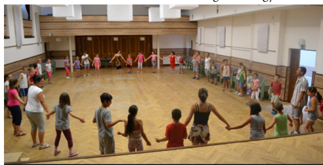
KÖZÖS TÁNC TANULÁS

az iskolába visszavonulva elfogyasztottuk a jól megérdemelt süteményeket és kenyérlángost egy közös, családi hangulatú lakoma keretében. A pénteki nap mindenki számára izgalmasan telt. A zenei napot közös énekléssel, daltanulással, zenéléssel és tánc tanulással tölthettük el a Közösségi Ház nagytermében.