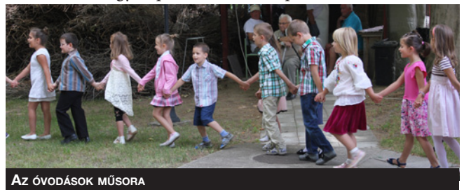
AZ ÓVODÁSOK MŰSORA