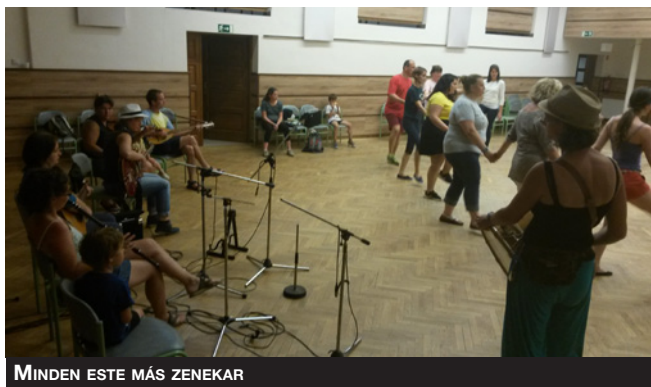
MINDEN ESTE MÁS ZENEKAR