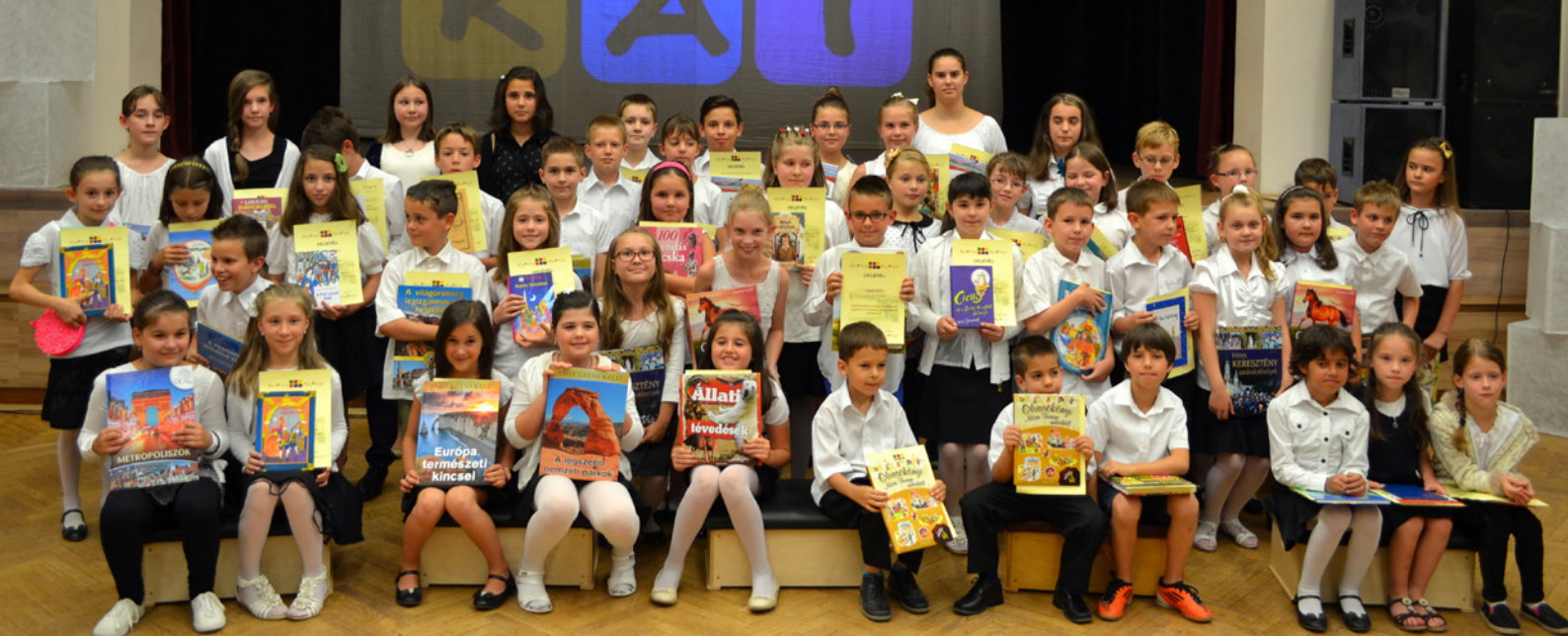
TANÉVZÁRÓ - KITŰNŐ TANULÓINK