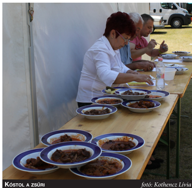
KÓSTOL A ZSŰRI