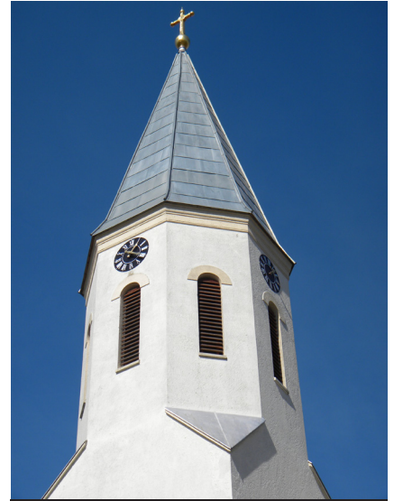
A FALU ÚJ ÉKKÖVE

Adalbert atyának nem tudtam szólni, mert ekkor már elutazott a Szentföldre. A szerelésre négyfős csapat érkezett reggel 7 órára, és délután fél négyre már készen is voltak. Szenzációs látványt nyújtott az a szerelő, aki kötélén lógva végezte