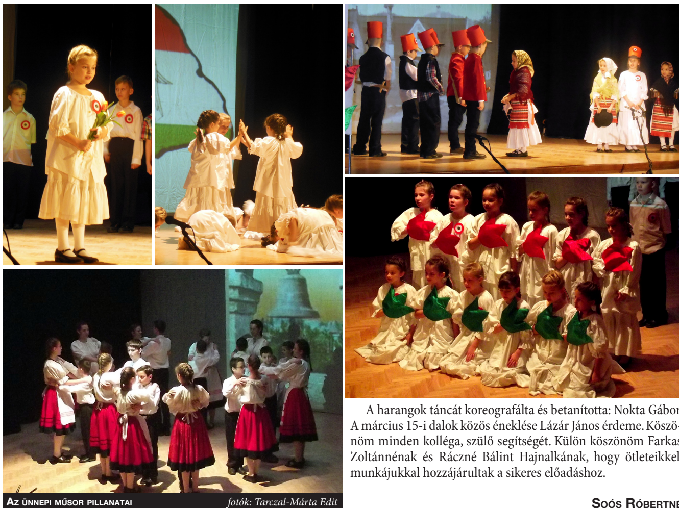
AZ ÜNNEPI MŰSOR PILLANATAI