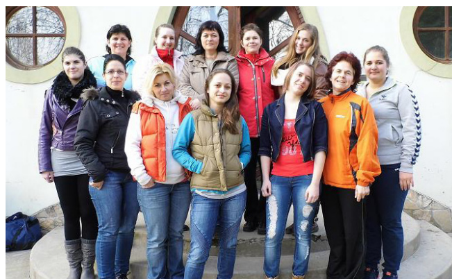
EGYÜTT A CSARNOK BEJÁRATA ELŐTT: