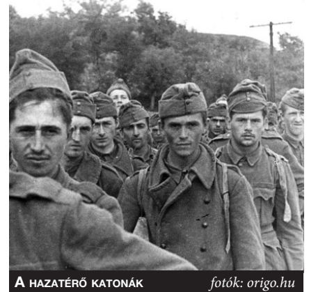
A HAZATÉRŐ KATONÁK