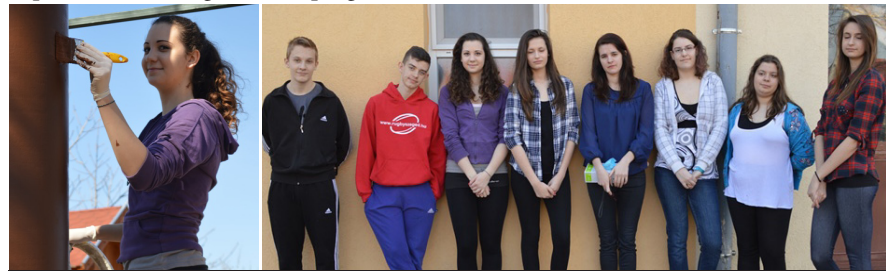
MUNKÁBAN A TAVALY VÉGZETEK