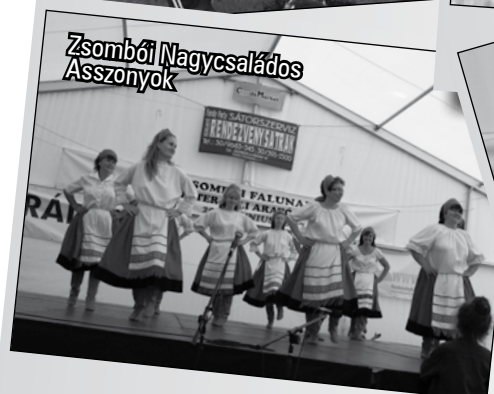
Zsombói Nagycsaládos Asszonyok