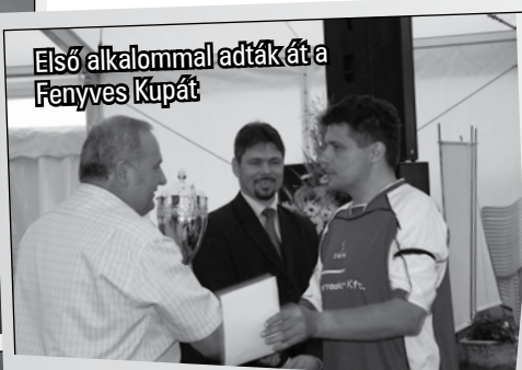
Első alkalommal adták át a Fenyves Kupát