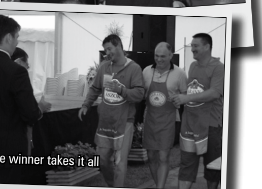
The winner takes it all