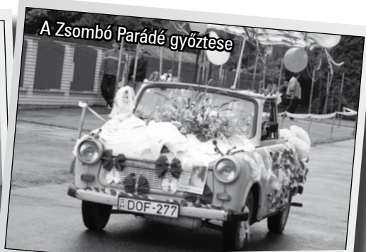
A Zsombó Parádé győztese