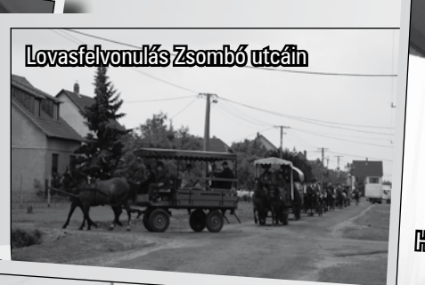
Lovaszfelvonulás Zsombó utcáin