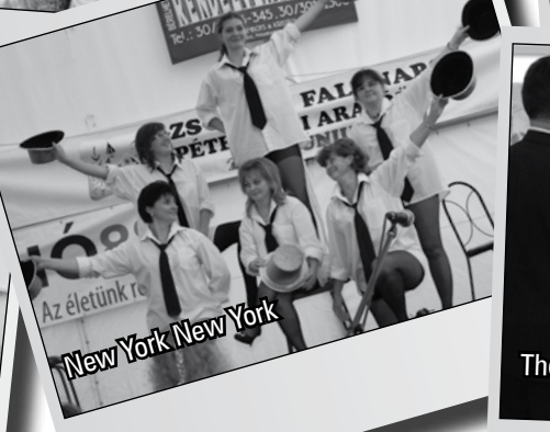
Az életünk re New York New York