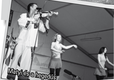
Matyi és a hegedűs