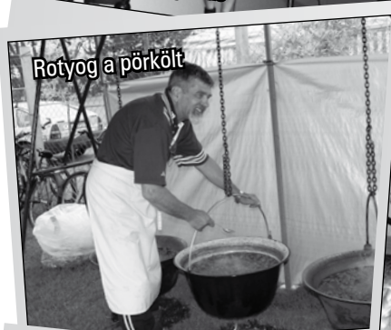
Rotyog a pörkölt