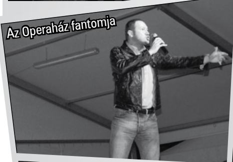
Az Operaház fantomja