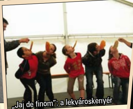
„Jaj de finom”: a lekvároskenyér