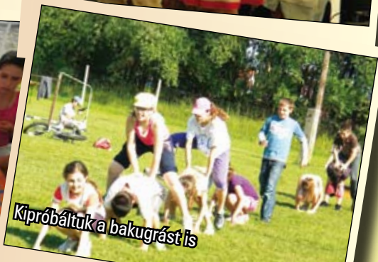
Kipróbáltuk a bakugrást is