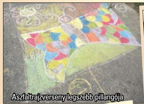
Aszfaltrajzverseny legszebb pillangója