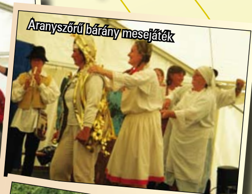
Aranyszőrű bárány mesejáték