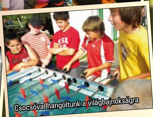
Csocsóval hangoltunk a világbajnokságra

További képek elérhetőek a www.kultura.zsombo.hu weboldal galériájában