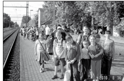
A két nap élményeiről szólnak a beszélgetők.

Így indultunk nagy várakozással 14-én Szatymaz állomásról, ahová szülők szállították ki a gyerekeket és bennünket, pedagógusokat.