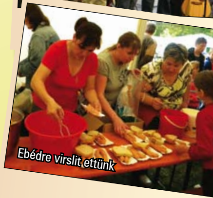
Ebédre virslit ettünk