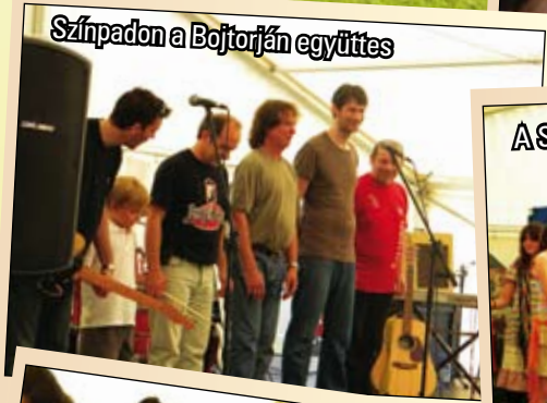
Színpadon a Bojtorján együttes