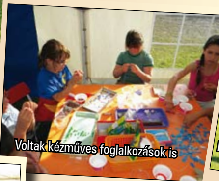
Voltak kézműves foglalkozások is