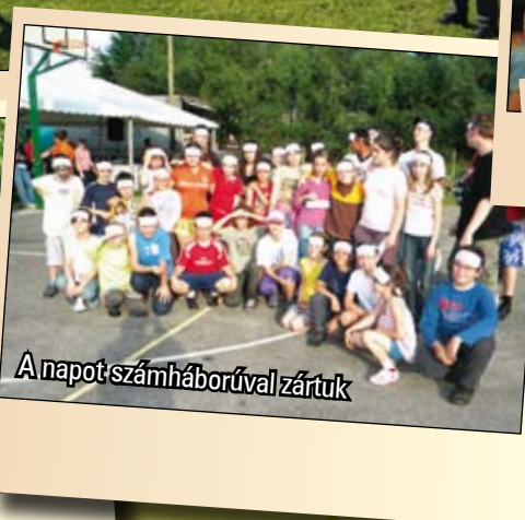
A napot számháborúval zártuk