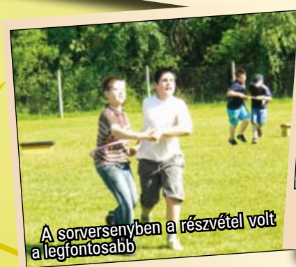
A sorversenyben a részvétel volt a legfontosabb