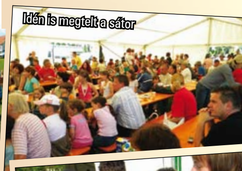
Idén is megtelt a sátor