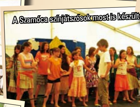
A Szamóca színjátszósok most is készültek