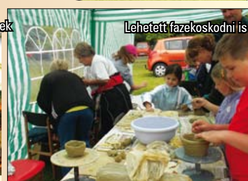
Lehetett fazekoskodni is