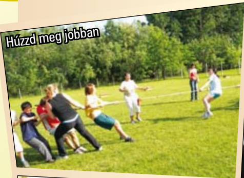
Húzzd meg jobban