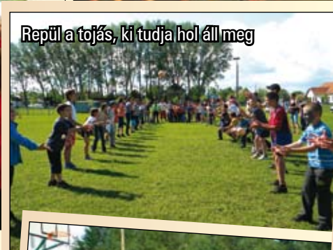
Repül a tojás, ki tudja hol áll meg