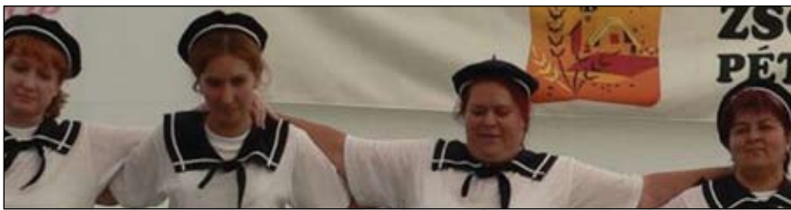
Arató ünnep - Falunap

Na végre ez is ideért! Nemhiába ültünk össze már két hónappal ezelőtt, hétről hétre, végül csak sikerült! Vége az izgulásnak. Mostmár látjuk a munkánk eredményét, mert vigalomban, ötletben volt részünk bőven. Ez talán látszott is a sok színes programon, látónivalón. A szépen megtisztított sportpálya és játszótér látványa, már napok óta felkeltette az arra járók figyelmét, hogy itt valami nagy esemény készül. A falu életébe ez a második nagyszabású falunap. Bár „falunapnak” nevezett délután évek óta volt, de talán most teljesebb ki igazán. Mindenki kedvére válogathatott a műsorszámok közül. Kicsit félve kezdtük meg a 2 és fél naposra tervezett rendezvény összeállítását, félve attól, hogy ilyen dologidőbe lesz-e majd