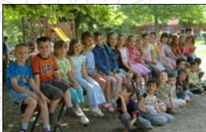
Tőlük BÚCSÚZTUNK 2008. május 30-án.

alapján egyre nő az egész napos ellátás iránti igény. Az eddig beíratott új óvodás létszáma: 27 fő (június 11-i állapot szerint).