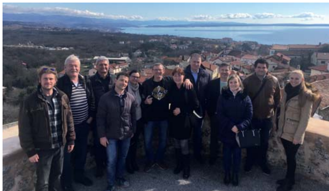
A projekt első nemzetközi találkozásának résztvevői

projektötlet a horvátországi Kanat – Kastav Egyesülettől származik. Szükségét érezték egy olyan tudás megszerzésének, amely hozzájárul a zenei és kulturális örökség megőrzéséhez, fejlesztéséhez, népszerűsítéséhez.