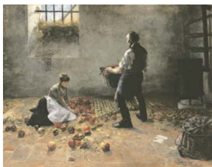
Karcsay Lajos: Almaszüret c. festménye

160 évvel ezelőtt, 1860. február 18-án született Karcsay Lajos festőművész a Vas megyei Kiskölkeden. Az egyházasrádóczi és erdőkarcasai Karcsay családnak Nagygeresden volt a kúriája és birtoka. A művészeti pályához érzett kedvet, és az érettségi után Münchenbe utazott, s három évig a