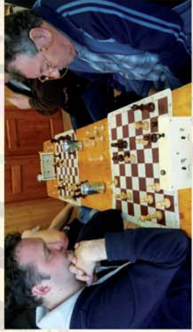
■ Sakkoztak tömörön 15. oldal