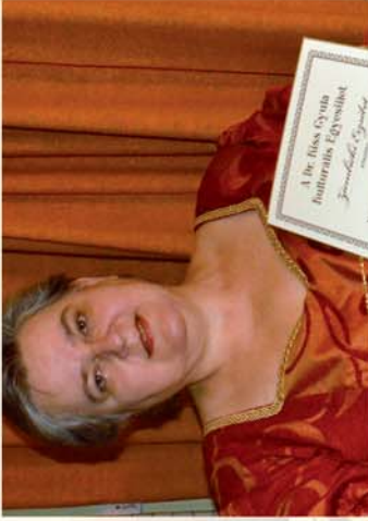
■ Közösségi Kultúraért-díj 12 oldal