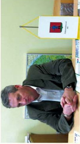
■ Interjú Bó polgármesterével 4. oldal