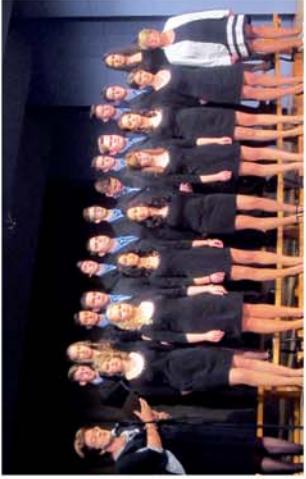
■ Szalagot kaptak a büki szakiskolások 2. oldal