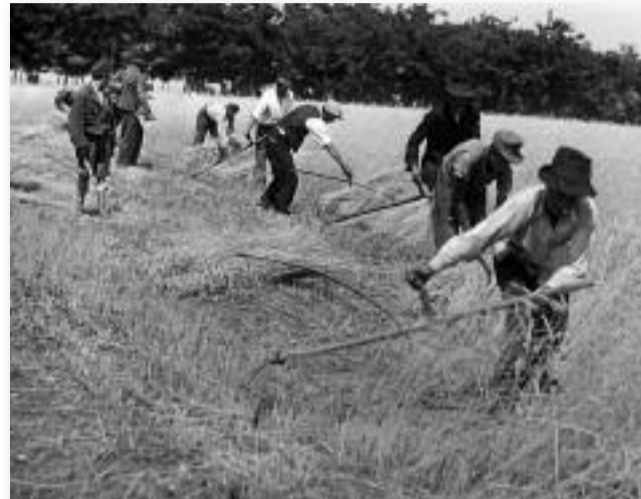
Fáradtságos munkával került étel az asztalra

Mindent hasznosítottak, például a pelyvát sárral keverték, ezt a házak tapasztására használták fel, amit a törekes sárral simítottak el. A