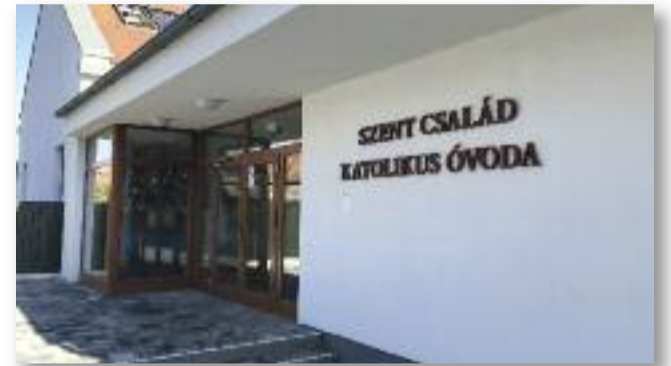
Az egykori Zárda-kápolna megújult épülete

Plébániánk, egyházközségünk hálás a lehetőségért, hogy a volt zárda épülete nem csak a múltban szolgálta városunkat, hanem a jövő nemzedék nevelésével is tevékeny részese életünknek. És nagy öröm, hogy a Zárda-kápolna megújulva vár mindannyiunkat imádságra, szentmisére!