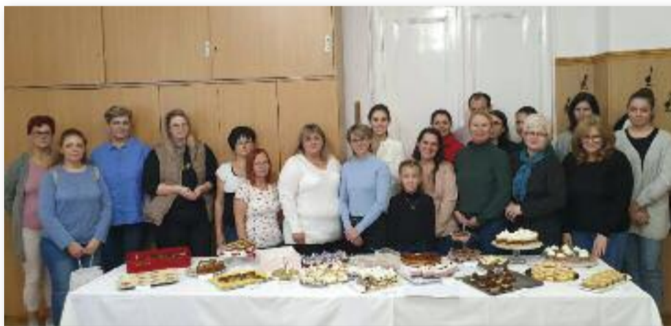
A verseny hobbi cukrászai

Az eredményhirdetés végén a résztvevők is megkóstolhatták a „cukrászda” kínálatát, ahol a hagyományos sütik mellett más nemzetek édességeit, valamint fantázia névvel ellátott tortaszeleteket is megkóstolhattunk: macaron, különféle muffinok és krémesek, marlenka, gluténmentes sütemény, citromos szelet, szabolcsi almás mákos és sok más édesség közül válogathattunk. Reméljük, hogy jövőre is találkozunk egy újabb édes kalandban.