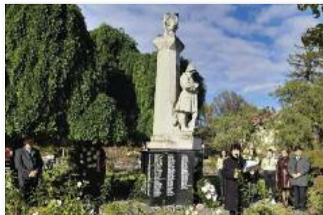
Tisztelgés a hősök előtt

egyre kevesebben vagyunk olyanok, akik rokonokat fedeznek fel az emlékművek neveket soroló kőlapjain.