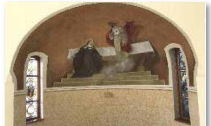
„A Jóisten áldása, szeretete érződik a falak között”