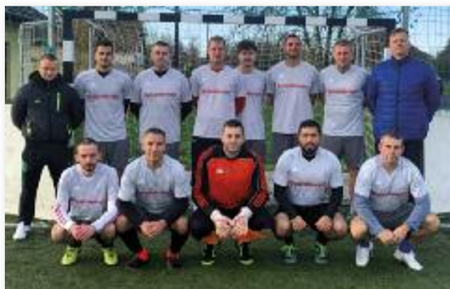
A háromszoros bajnok csapat

Minden kedves csapatvezetőnek, játékosnak szurkolónak, olvasónak és családjuknak, jó egészséget és békés boldog közelgő ünnepeket kívánunk!