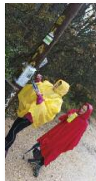
A Virágos-nyereg tetején

HA VAN CÉL, VEZET ODA ÚT IS! VAN EGY MONDÁS: "ROSSZ IDŐ NINCS, CSAK ROSSZUL ÖLTÖZÖTT TURISTA!" /ISMERETLEN/