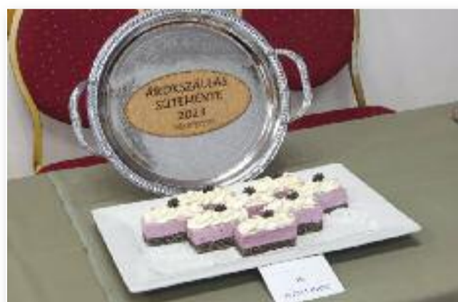
A győztes sütemény