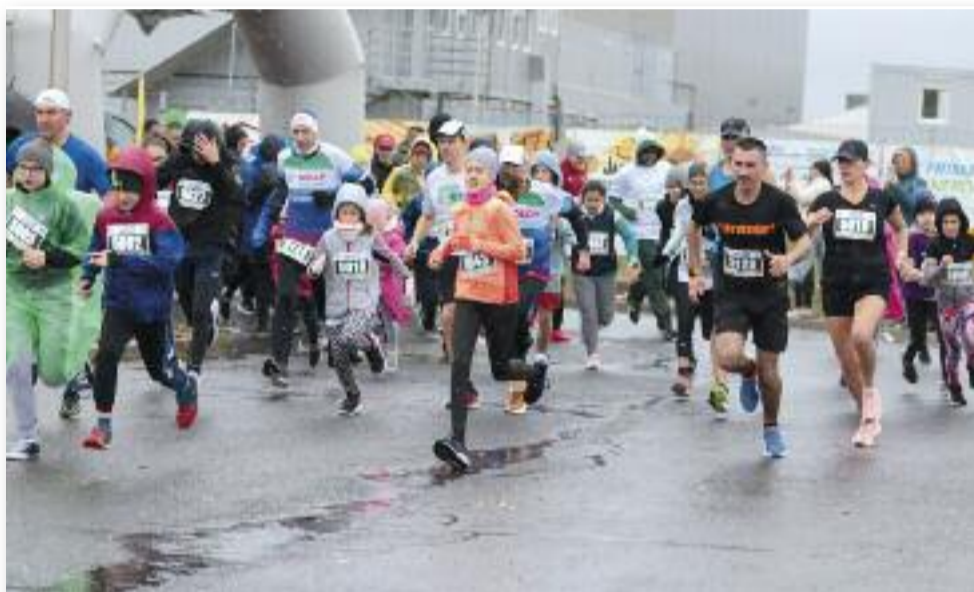
Ázós, boldog futás

2023. november 5-én megrendezésre került az I. Jaszi-Jágó Jövet-Menet futóverseny.