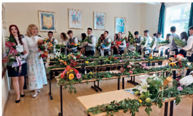
A 12. A osztály

böző intézmények, szervezettek képviselői. Az áprilisi költemény a gimnazisták előadásában csendült fel, Az apostol című elbeszélő költemény egy részlete, a híres szólószem-hasonlat. Folytatás a 4. oldalon.