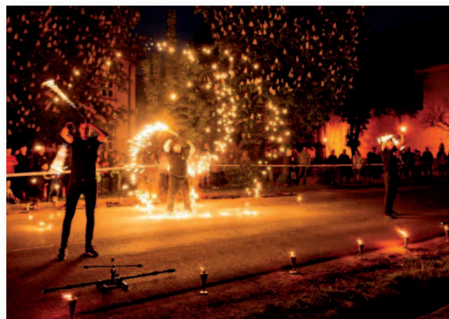
A Jugglers of the Village csapat bemutatója

A köszöntőt követően Marót Viki és a Nova Kultúr zenekar élő, másfél órás koncertje zárta a napot, ahol fellépett városunk szülőtte, Ördög Dóra is, aki évek óta az együttes oszlopos tagja. A vele készült interjút ebben a lapszámunkban olvashatják.