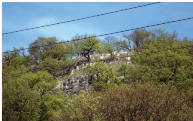
"Amikor a hegy oldalából fák nőnek"

A Mária-szakadék, a Buborék völgy is olyan hely (ugyan nem a Kéktúra útvonalán van), amelyen érdemes végigmenni. A látvány, a csend és a környezet megnyugvást és pihenést ad. A Buborék-