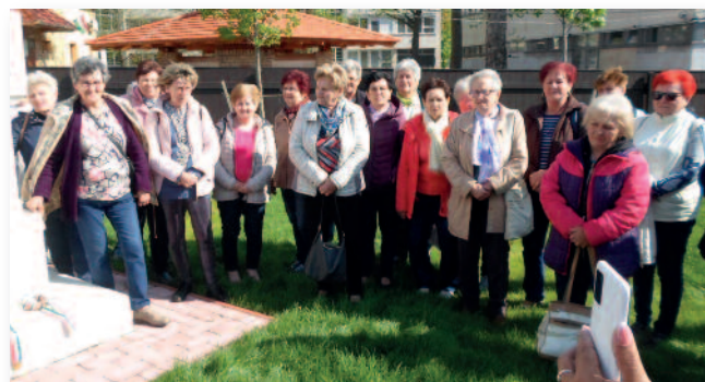
Kiskőrösön, a Petőfi-emléksobornál

Kiskunhalas. Ha e település nevét halljuk, bizonyára mindenkinek a halasi csipke jut eszébe. Mi látogatást tettünk oda, ahol a csodák születnek.