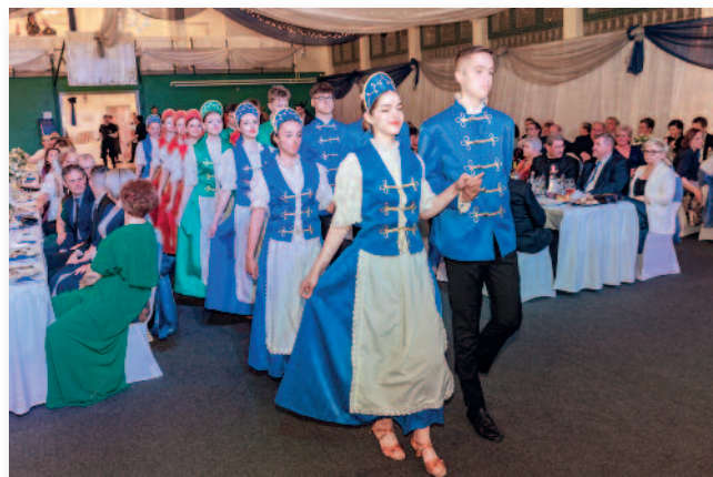
A bál nyitótánc a palotás volt