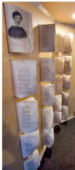
A tárlat a költő életművét mutatja be

höz kézműves foglalkozás keretében alkothattak a közelgő anyák napjára. Ezúton is köszönjük mindazoknak a támogatását, akik bármilyen formában hozzájárultak a program megvalósításához.