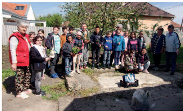
Gyógynövények ültetése a Szent Vince úti iskolában

Május 5-én délelőtt a Széchenyi István Általános Iskola 8. osztályos tanulóival közö-