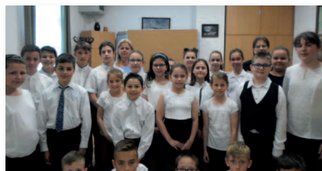
Az anyák napi ünnepség szereplői

Júniusi előzetes: paprikás krumppli főzés (a helyszín szervezés alatt).