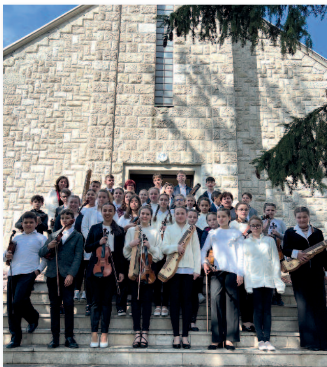
A zenetábor résztvevői

városunk önkormányzatának, a Bundy és a Weger Hungaria Kft-nek, valamint a szülőknél a táborhoz nyújtott anyagi támogatásért.