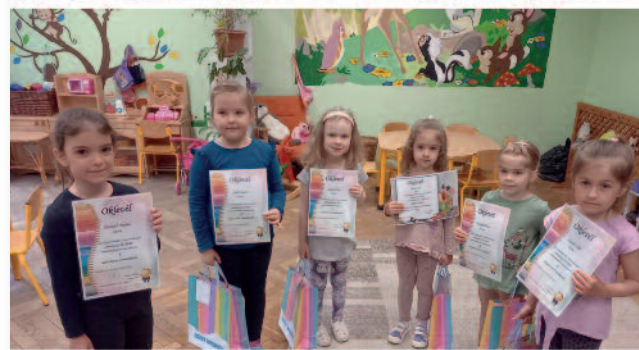
A rajzpályázat nyertesei

egy-egy eseményhez kapcsolódó különböző terve-