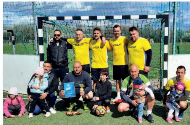
A győztes csapat

Várunk minden érdeklő- dőt, szurkolót vasárnap dél- előttönként.