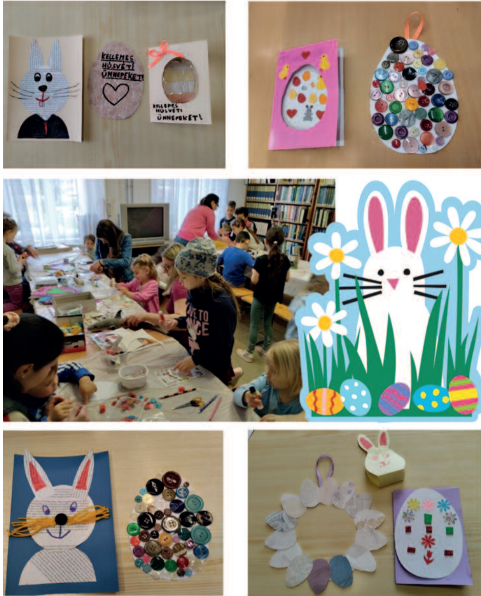
Most is sok ötletes alkotás született a foglalkozáson

KÖVETKEZŐ KREATÍV FOGLALKOZÁS IDŐPONTJA ÉS TÉMÁJA: 2023. JÚNIUS 03. (SZOMBAT), 08:30-11:30 KAVICSFESTÉS, KAGYLÓFESTÉS VÁRUNK MINDENKIT SZERETETTEL!