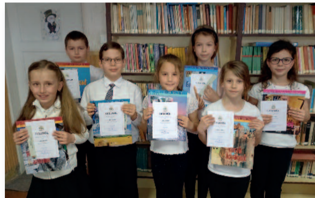
Az Arany-száj szépolvás verseny győztesei

kaptunk az olimpiák történetébe, szinte magunk előtt láttuk a földalatti mesevilágot, az Aggteleki cseppkőbarlangot, képzeletben elrepültünk