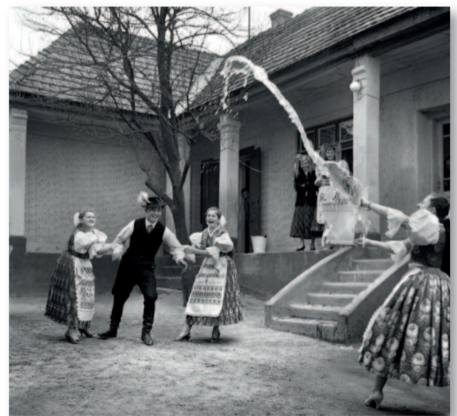
A húsvéthétfőt követő kedden a lányok locsolták a fiúkat

ismét tiszteletüket tették a családnál és a nőket, lányokat megöntözték nyakba öntött hideg vízzel. Köszönetképpen festett tojást kaptak, amit akkor még vöröshagyma héjával színeztek.