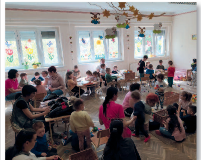
A leendő óvodások bátran fedezték fel a csoportszobákat

Másnap reggel 9:00 órától a gyerekek és szülők is betekintettek az óvodai csoportok életébe, lehetőségük volt beszélgetésre a pedagógusokkal. Vendégeink főként az iránt érdeklődtek, hogy milyen a csoportszobák, milyen a környezet, mekkora az udvar és milyen játékok vannak nálunk. Mind a 11 csoportba lehetőségük volt bemenni, bekapcsolódni a játékba, részt venni a gyerekek tevékenységeiben. Nagy örömmel tapasztaltuk, hogy a kicsik bátran léptek a csoportszobákba szüleiüket az ajtóban hagyva. Szinte min-