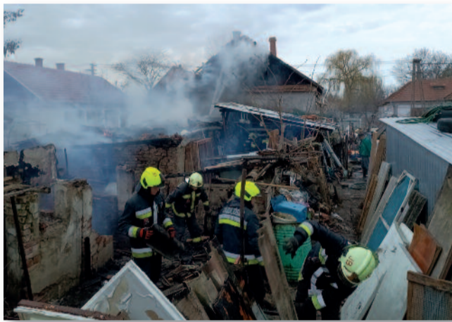
Márciusban több lakóház-tűz miatt kellett intézkedni a tűzoltóknak

kerti hulladék égetése szer- dai és pénteki napokon, 10:00 és 17:00 óra közötti időszakban lehetséges. Azonban szigorúan tilos az országosan elrendelt általá- nos tűzgyújtási tilalom ide- jén égetni, valamint szeles, viharos időben! Kérjük a la- kosokat, hogy figyeljenek a testi épségre és az anyagi ér- tékekre, tartsák be a rende- letet! Ellenkező esetben az Országos Katasztrófavé- delmi Főigazgatóság, mint il-