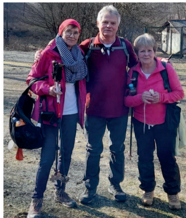
Szolnoki túratársakkal Lajosházán

Kedves meglepetés, hogy az egyik pontőr egy ismerős gim- nazista lány, aki az érettségi- hez kötelező 50 óráját tölti.