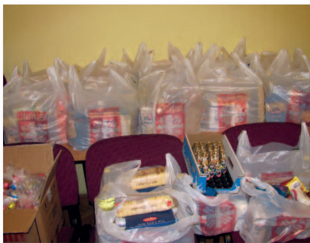
429 kg tartós élelmiszert vehetett át 75 család

Közösségi Háznál. Köszönjük az adományozók, támogatók adományait a rászorult családok nevében. Ugyanezen a napon a résztvevők számára ingyenes ruhaosztást is rendeztünk. Örülünk, hogy kicsit ugyan, de a húsvéti ünnepi asztalra csoportunk is tudott tenni a családoknak.