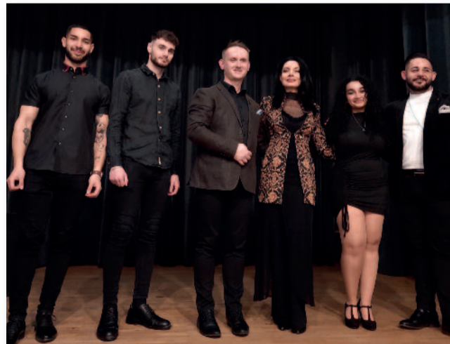
A gimnázium diákjai és a meghívott vendégművészek

Az előadásnak hihetetlen sikere volt. Egy újabb feledhetetlen élménnyel gazdagodtam a nap végére. A közönségtől rengeteg pozitív visszajelzést kaptunk. Remélem, hogy nem ez volt az utolsó felkérés, amit tanár úrtól kaptunk. Bízom abban, hogy a jövőben is biztosít majd fellépési lehetőségeket úgy, mint iskolánk több volt diákjának.