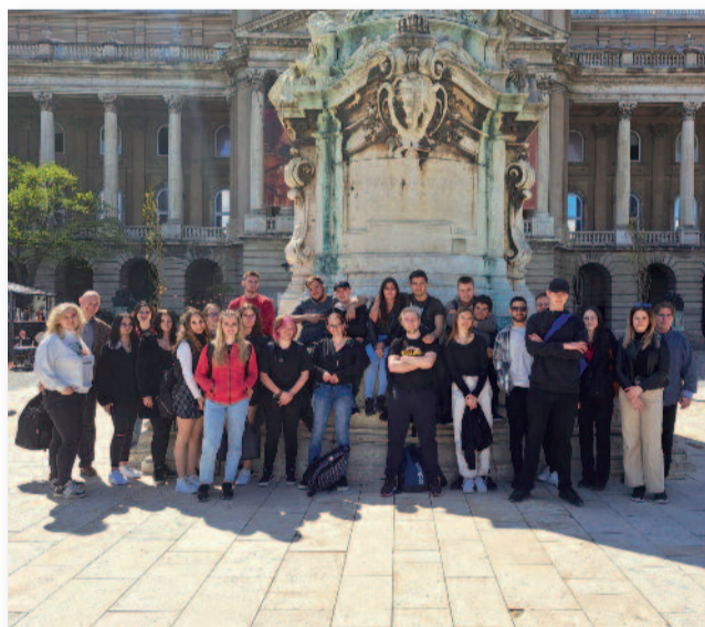
A kirándulás résztvevői

Megnéztük a nevezetesség közül a királyi Lovardát is, amelynek felújított épü-