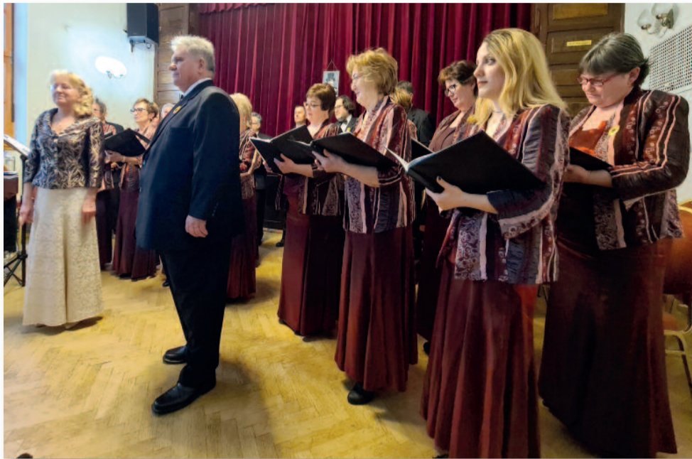
Giuseppe Verdi műveinek legismertebb dallamai csendültek fel

SZÖVEG ÉS FOTÓ: LÓCZY PÉTER PETŐFI MŰVELŐDÉSI HÁZ