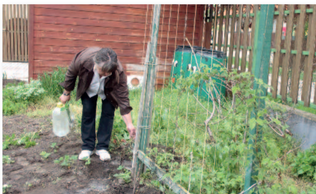
Elkezdődtek a tavaszi munkálatok az óvodákban

Az időjárás már megengedte a kerti munkákat az óvodákban és az iskolákban.