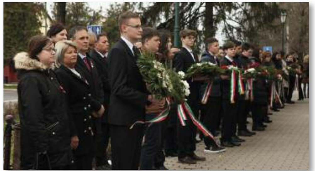
A megemlékezés koszorúzással vette kezdetét