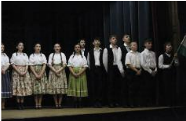
Az ünnepi műsor Petőfi életének fontosabb állomásait idézte meg

képviselő-testület tagjai, in- tézsmények, civil szervezetek vezetői emlékeztek együtt a '48-as eseményekre.