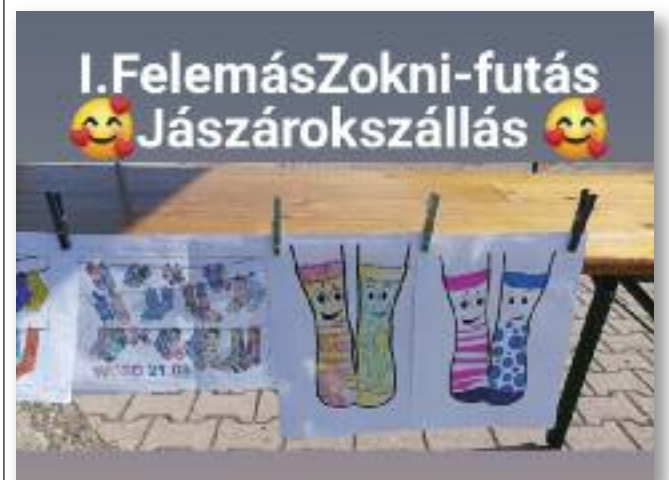
Március 21-e a Down-szindróma világnapja