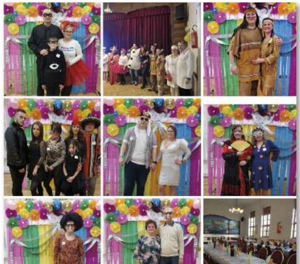
Ötletes jelmezekben érkeztek a vendégek

Köszönöm a családomnak és a barátainak azt a rengeteg támogatást, bátorítást, hogy igen is meg tudtam/tudtuk csinálni és a vendégeinknek is, hogy hittek bennem/bennünk és elfogadták a meghívást. Az iskolánk napközis gyermekei is hamarosan megkapják a játékokat. Jövőre újra találkozunk a II. Farsangi bálon!