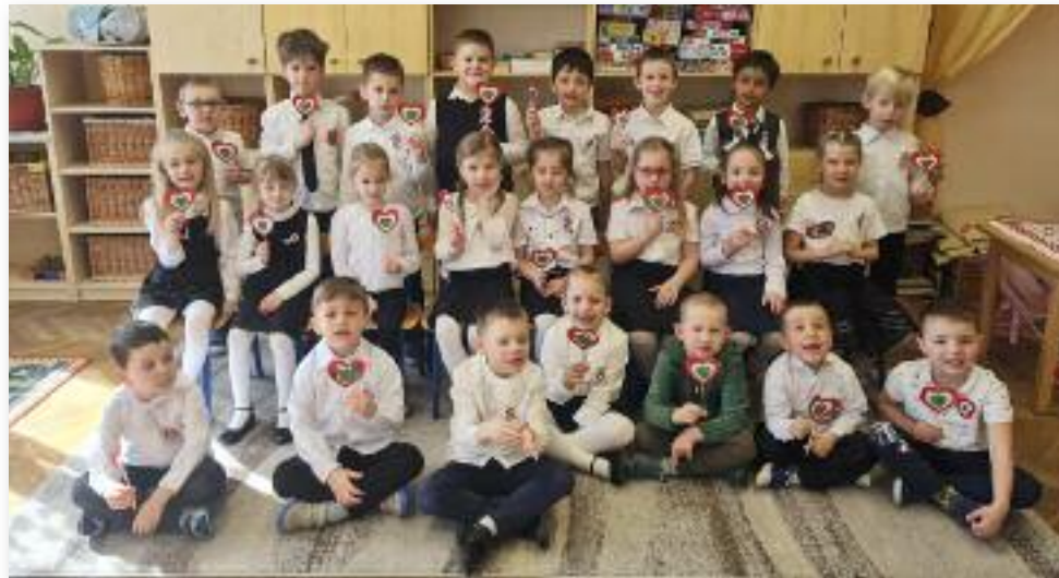
A gyerekek óvodásként megismerik történelmünket

Hogyan tegyük a gyerekek számára is átélhetővé nemzeti ünnepünket? Az ünnep és az azt megelőző ráhangolódás különbözik az óvodai mindennapoktól. Az ünnep hangulatát az óvoda helyiségeinek, ablakainak díszítésével alapozzuk meg, amelyben megjelenítjük az adott ünnepre jellemző színeket, szimbólumokat. Az ünnepi készülődés az együttléti örömet adja, erősíti a hagyományokat, a közös élmény erejével fokozza a gyerekek kö-