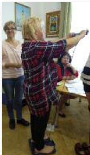
Folyamatos BMI ellenőrzés Omron készülékkel

sével. A második foglalkozáson – március 21-én, a Petőfi Művelődési Házban – színes zöldségekből főztünk levest, amit sajtgombóccal tettünk teljessé. A fenntart-