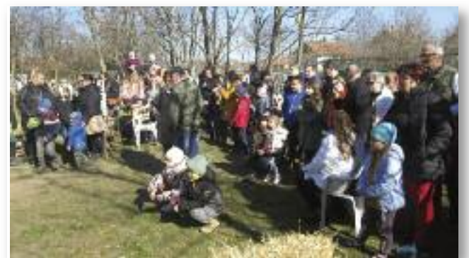
A busóknak hála, sikerült elúzni a telet