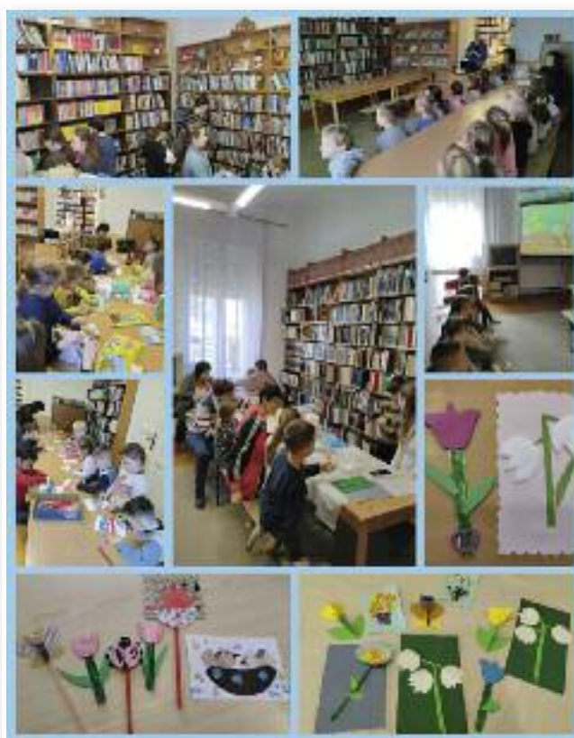
Életképek márciusi rendezvényeinkről