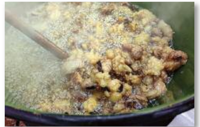
24 bográcsban sült a tepertő

Már idén elkezdjük a jövő évi Tepertő Sütő és Pálinkamustra rendezvény szervezését.