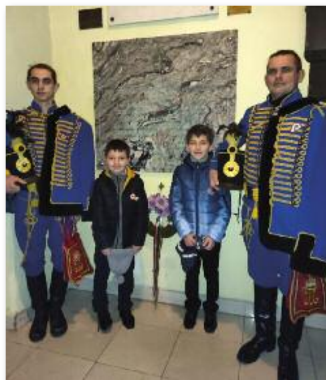
A 160. évfordulóra állított emléktáblánál

SZÖVEG: MIHÁLYINÉ GÖRBE ERZSÉBET