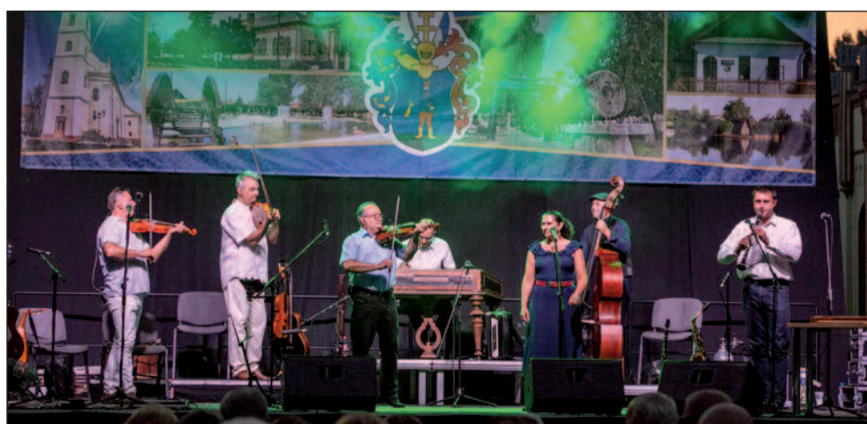
Színpadon a Csík Zenekar

Az idei Szent István napi rendezvény a múlt, a hagyományok, a népiesség jegyében telt. A városközpontba látogatók úgy érezték, visszarepültek az időben – a jurta sátor, a népi játékok, a népzene, a néptánc és a vásári komédiások mind-mind erősítették bennünk a magyarság értékeit, melyekre a XXI. században is büszkék lehetünk és melyek meg nem szűnő értéket képviselnek.