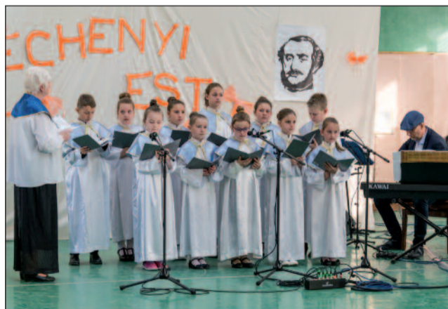
Az estet a Schola Thrinitas énekkar nyitotta meg

országban, sőt a határokon túl is. Járják az országot, táncukkal, énekükkel, hangszeres játékkal, előadásukkal kápráztatják el a jelenlévő közönséget. Sport területén is