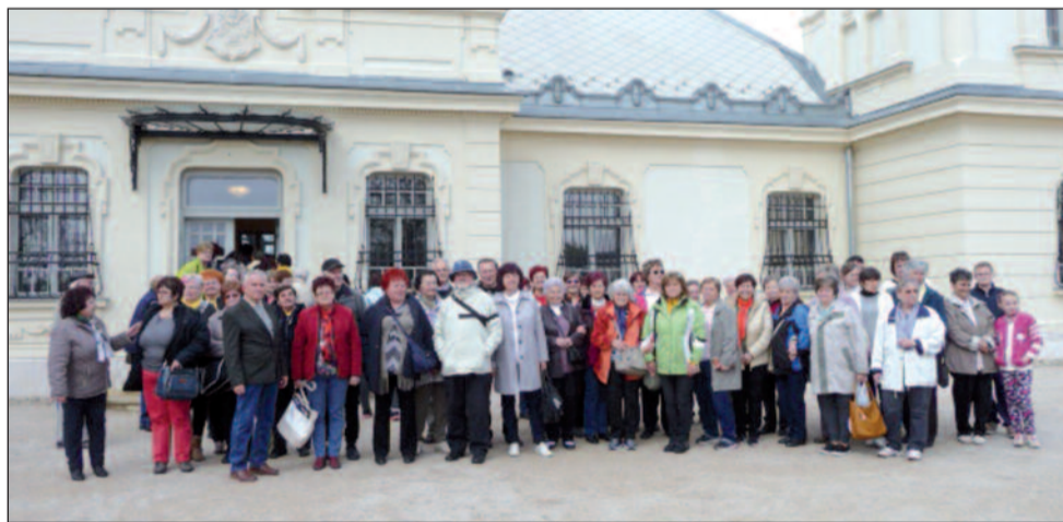
A Halász kastély parkjában Kápolnásnyéken