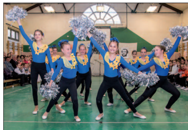
Egy csodálatos koreográfia a mazzorettes csoporttól

esten 350.000,- forint gyűlt össze, melyet köszönünk az érdeklődőknek, támogatóknak. Ez az összeg, bízunk benne, hogy a szülői értekezleteken a támogatói jegyek vásárlásával még gyarapodni fog. Ez évben egy kulcstartót kapott minden támogató, melyen iskolánk névadója és az alapítvány száma is szerepel.