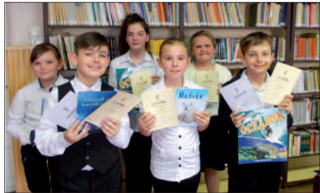
Az AranySzáj Szépolvasó Verseny győztesei

vasolt könyv megtanít jobban összpontosítani. Amikor egy könyvet olvasunk, a teljes figyelem középpontjába a történet kerül, amiben egy szempilantás alatt elmerülünk.