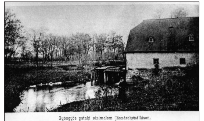
Gyöngyös pataki vízimalom Jászárokszálláson.