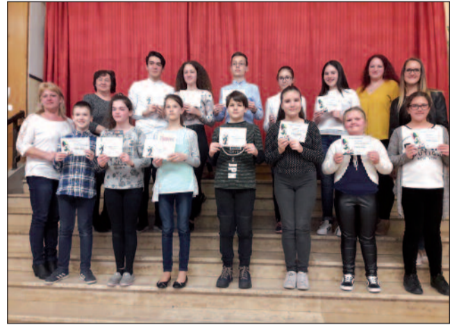
NyelvÉSZ verseny résztvevői, nyertesei és felkészítőik

és bemutatták, hogyan épül fel a harmonika. Megszólaltatták a magas és mély hangokat, változott a hangerő, a hangszín. Mikor már úgy gondoltuk, hogy nem tudhatunk meg többet e hangszerről, csodál-