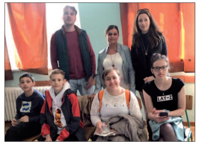
Álmodó napja versenyzői és felkészítőik

kozva hallottuk, hogy hol orgona, máskor fagott, később hegedű hangját is képes volt megszólaltatni. A közönség együtt didergett, mikor Vivaldi Téli tétele megszólalt. Boldogság, szomorúság ült ki a közönség arcára egy-egy zenemű hallgatása közben. Nagyon fontos gyermekeink szempontjából, hogy értékes zenét halljanak, közvetlenül ismerkedjenek meg a hang-