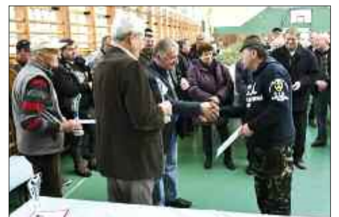
Díjkiosztás egymás közt