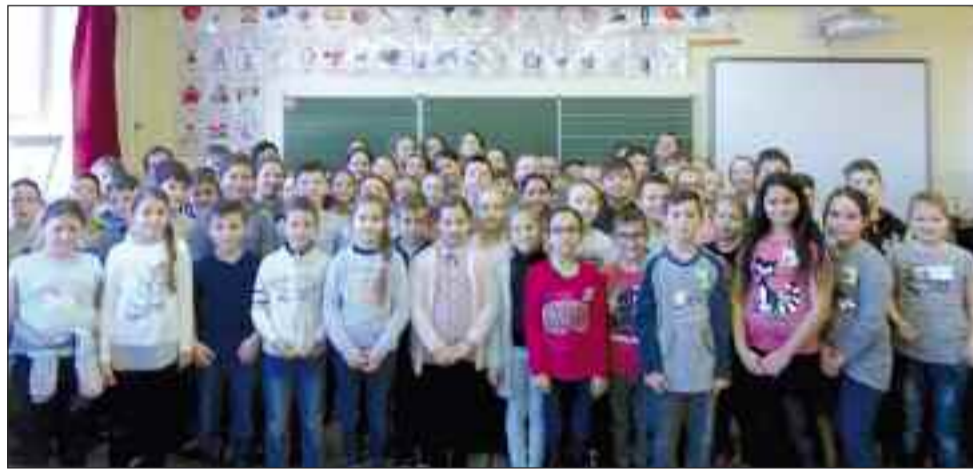
A mesevetélkedő résztvevői