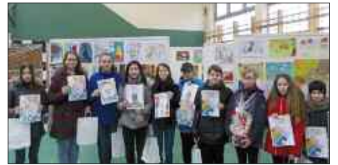
A rajzpályázat díjazottjai és alkotásaik