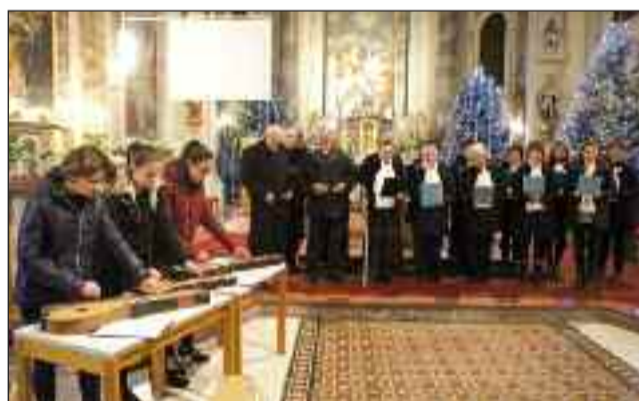
Énekel dicsérjük az Urat a templomban

Az elmúlt év kiemelkedő eseményei voltak a '48-as vasorán, a Város Napján, a Rendemptión, civil szervezetek ünnepi alkalmain, a Vajdahunyad-várban megrendezett jász napokon, az adventi