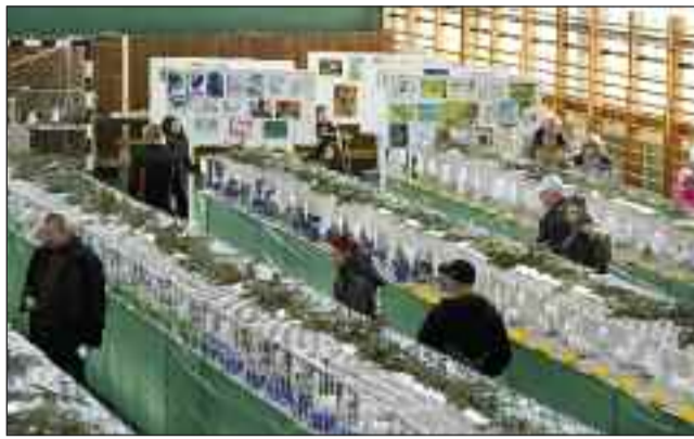
Kiállított állatok és a gyerekek rajzai érdeklődők körében

Minden évben egyre nehezebb a döntés a zsűrinek. Szívünk szerint az összes alkotást díjaznánk, de mivel ez verseny, ezért választanunk kell közülük. Az igazi győztesek azonban a látogatók, mert a kiállításon az összes alkotást megtekinthették. Minden résztvevő gyerekek ezúttal is