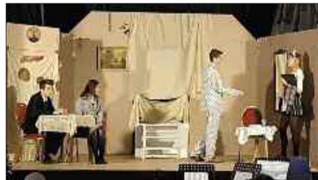
A 11. A vidám műsora

és diákoknak a részvételt. Felidézte a kisgyerekkori karácsonyok hangulatát, azt, hogy az érzelmeiket látszólagos nemtörődomséggel palástoló kamaszokban néha nehéz felfedezni a lelkesedést, csillogó szemű gyermekeket. Azt kívánta, hogy a szülőknek sikerüljön ez. A program a résztvevők megvendégelésével és közös beszélgetéssel zárult.