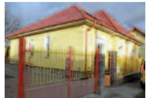
5123 Jászárokszállás, Kisfaludy u. 32/A., 212/A hrsz.