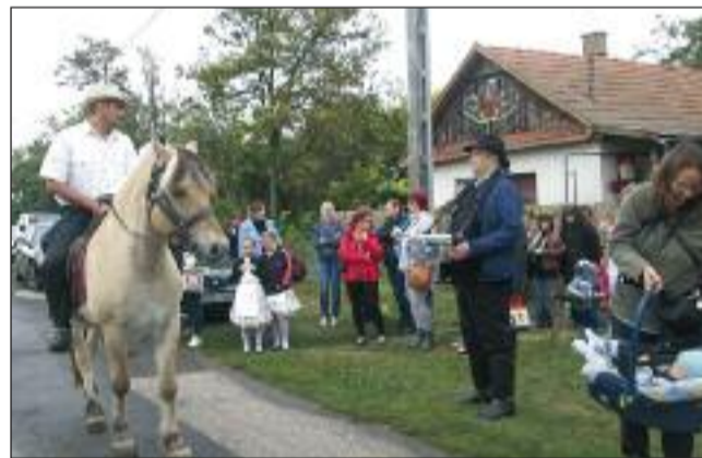
Készül a menet - lovassal és kikiáltóval

Mivel még a bérelt mobilkemma az udvaron van, a