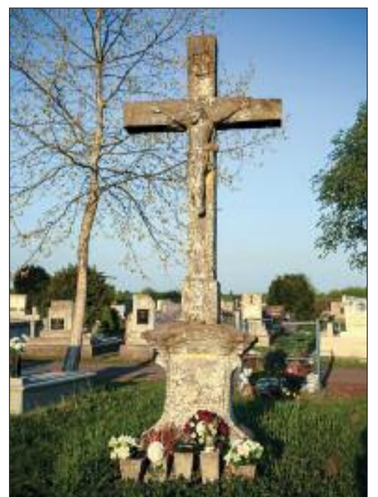
15. Sárga kereszt