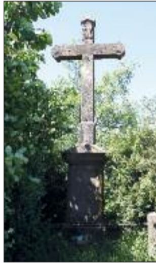
3. Görbe kereszt