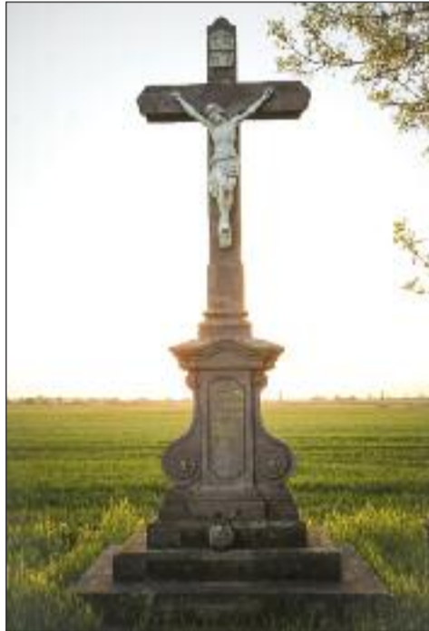
1. Bobák Mátyás kereszt