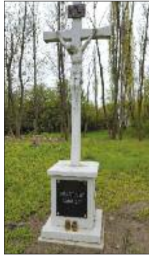
4. Gyarokparti kereszt