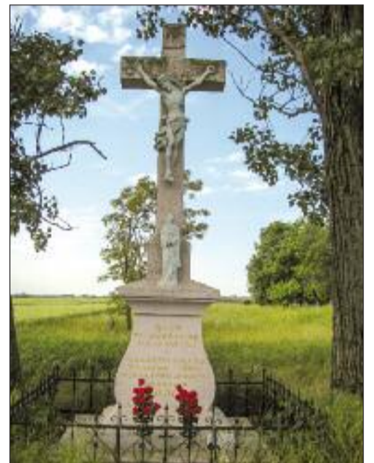
10. Nagyárki kereszt