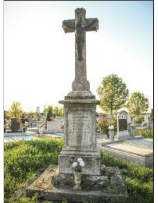
5. Gyenes kereszt