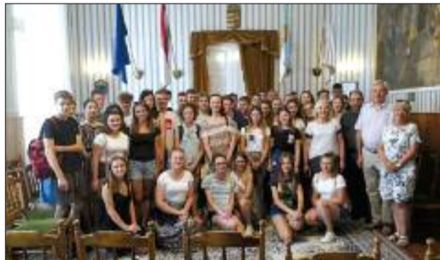
A lengyel csoport a Polgármesteri Hivatalban