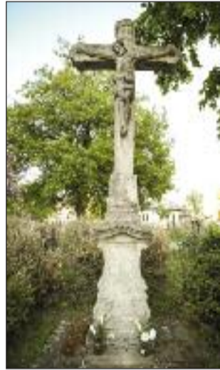
2. Feszület a templom mel- lett