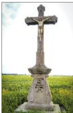
12. Pengyi kereszt