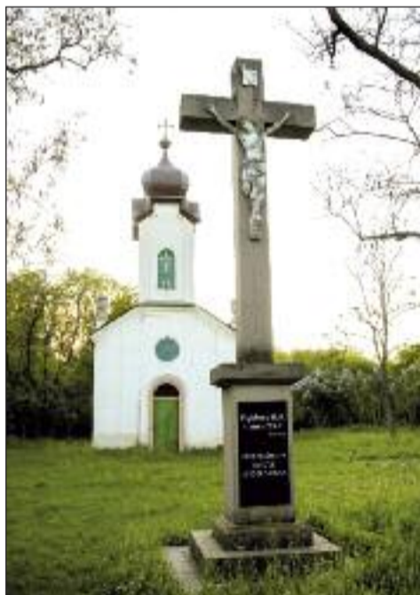
6. Havas Boldogasszony kápolnai kereszt