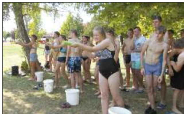
Vetélkedő a strandon

várvány, Trianoni emlékhely, izraelita temető, majd délután ügyességüket mérték össze vizes játékokban. Közös főzés, táncbemutató, találkozó a helyi művészeti csoportokkal tette még felejthetlenebbé a hetet.