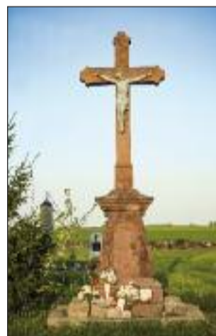
13. Pestises kereszt