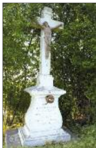
11. Négyzállási kereszt