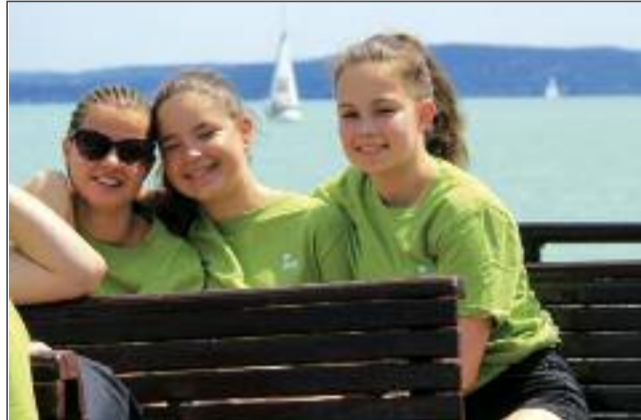
Felhőtlen hangulat a Sikertáborban

jainkat a trénerek különböző sportolási és szórakozási lehetőségekkel tették színebbé. A „korán kelők” számára minden reggel zumbát, illetve egyéb testmozgást biztosítottak.