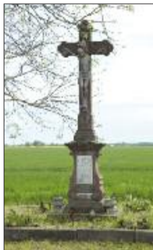
9. Mészely kereszt