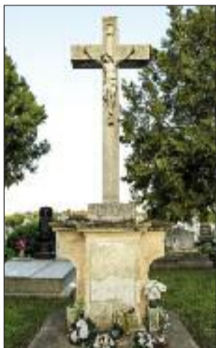
8. Libera kereszt