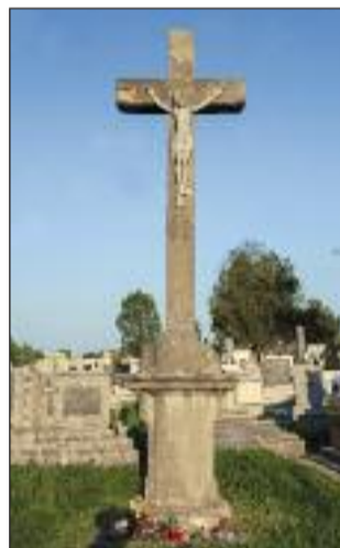
7. Kupolás kőkereszt