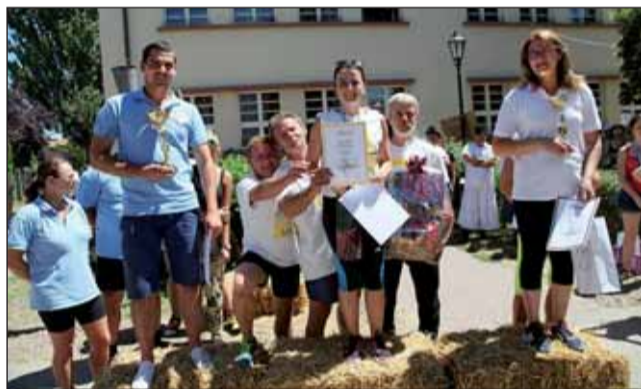
A Virtus verseny győztese a Sztárokszállás, 2. Jákóhalmi Betyárok, 3. Pusztai Jászok

folytatódott a jászági hagyományörző csoportok bemutatkozása, hogy majd újra koncertekkel (Holló Együttes, Bara zenekar, Hooligans) fejeződjék be a nap, mely koncerteket csak a XXII. Jász Világtalálkozó záró ünnepsége szakított meg. De folytatódhatott a nap pogácsa- és lángos kósto-