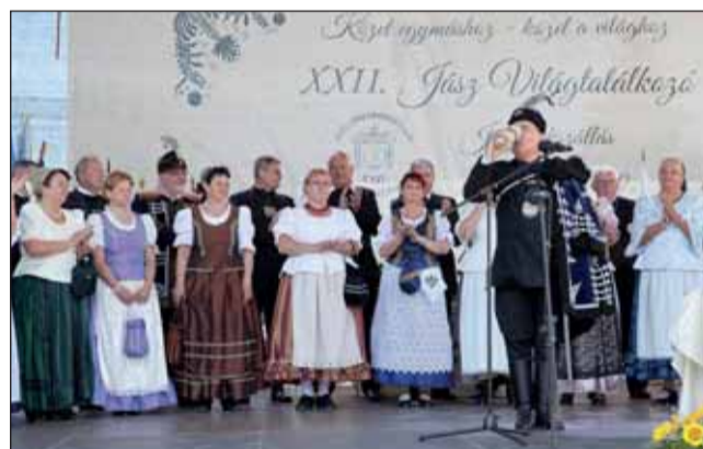
Iszik a jászok egészségére

történelmünk folyamán váltak magyarrá „ ebben a hatalmas dagasztó teknőben”, amit úgy hívnak Kárpát – medence. Az ügyvivő ezért tartja bölcs dön-