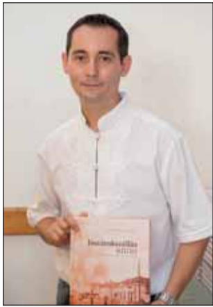
A szerző és a mű

A jászárokszállási családok szerencsésebbek a drámabeli Szkalla lányoknál, mert jó eséllyel megtalálják valamelyik felmenőjüket vagy rokonukat aközött a több mint 700 fénykép között, amelyet vitéz Balogh Balázs most megjelent könyvében, a Jászárokszállás annóban jelentetett meg. A képek tematikus csoportosításban mutatják be Jászárokszállás lakóinak 1945 előtti életét. Férfi és női fotók, gyermekek és bajszos férfiak, fényes csiz-