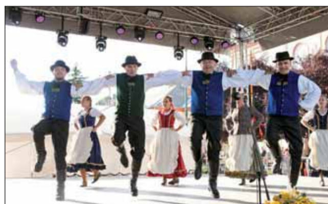
Parázs hagyományörzők a színpadon

elmondta, teljesítette az esküjében megfogadtakat. Szem előtt tartotta a jó kapcsolattartást, a méltóságteljes megjele-