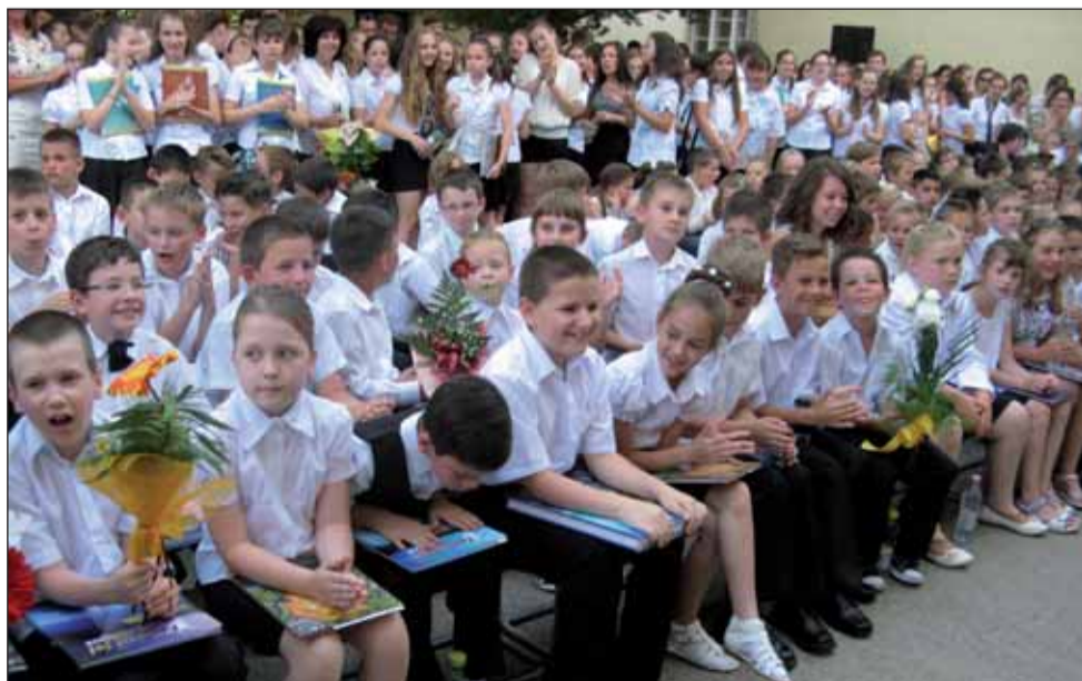
Öröm a kiváló tanulmányi munkáért járó könyvjutalom tulajdonosai arcán