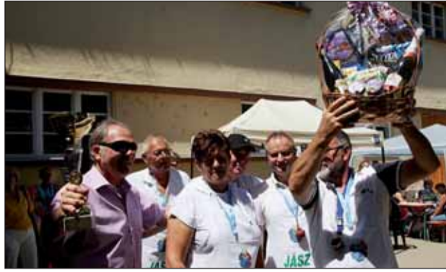
A Főzőverseny győztesei az Árokszállási Ipartestület

Ez köszönhető annak is, hogy a verseny előtti kedden 500 kg horogérett halat telepítettek. Délutánra újra nagyszínpadon a szereplők, ahol