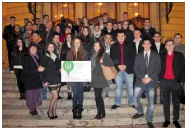
A színházba látogató DFG-sek

lunkban mindnyájan hegedűsök vagyunk a háztetőn. Kellemes, egyszerű dallamot akarunk kicsalni a húrokból, de úgy, hogy közben ne törjünk ki a nyakunkat. Nem könnyű. Kérdezhetnék: