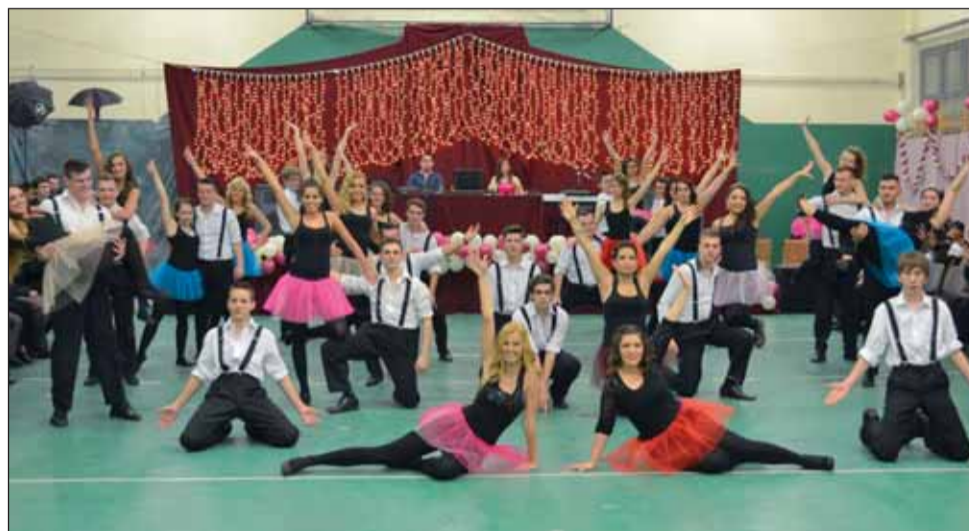
Latin mix a 12. A előadásában