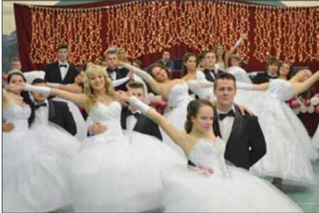
A bécsi keringő egyik részlete