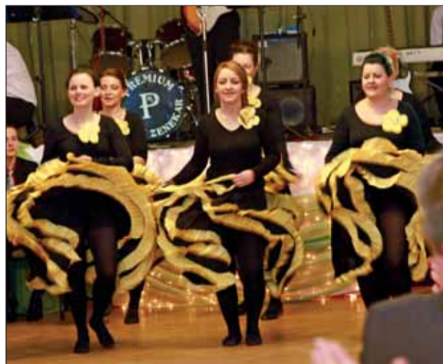
Kán-kánt járó anyukák