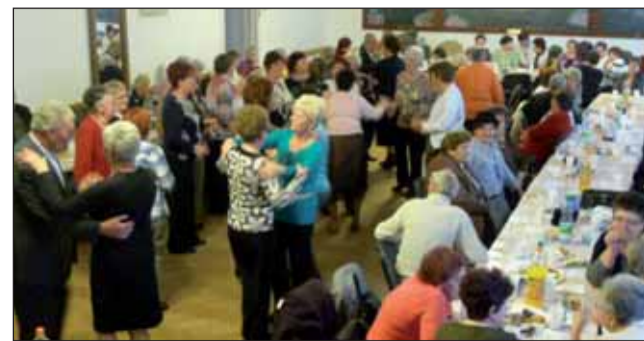
Nyugdíjas batyus bál

Ezzel a mondattal hívta tagjainkat még januárban az egyesület elnöke a februárban tartandó Batyusbálba. Nem is tétlenkedett senki, hiszen közel százán el is fogadták a szívélyes meghívást. Sokan hoztak saját süteményt, fánkot és apró süteményt. Kellemes délután, remek zene, amit Guba Józsi szolgáltatott és tombolasorsolás, ahol talán mindenki nyert, vagy nem! Remélem valamennyien jól éreztük magunkat és legközelebb is talál-