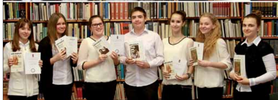
A büszke szépen olvasók

rendezett meg a Városi Könyvtár és a Széchenyi István Általános Iskola és Művészeti Iskola magyar szakos pedagógusai.