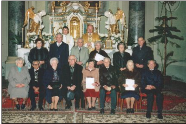
50 éves házassági jubilánsok