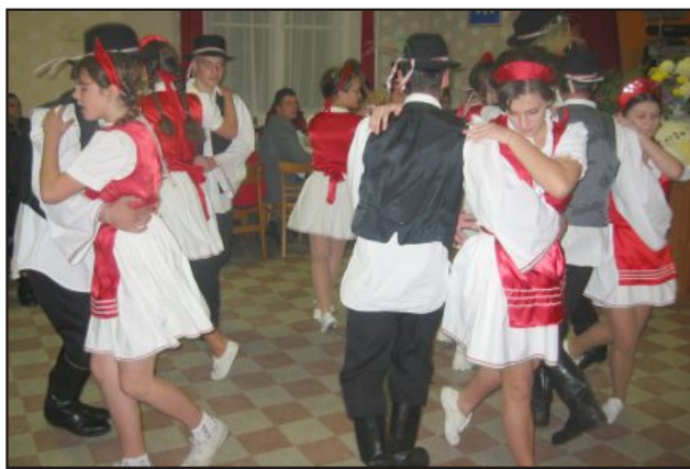
A középiskolások csárdása