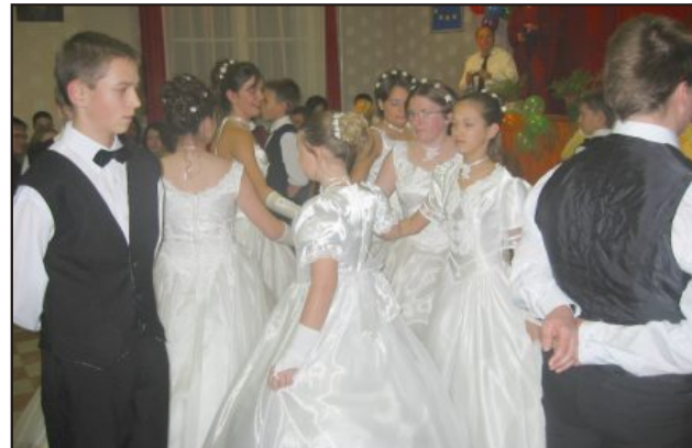
A felső tagozatosak keringője

Az est fénypontját természetesen most is a gyermekek jelentették. A sok jószándékú ember segítségét színvonalas, kedves mű-