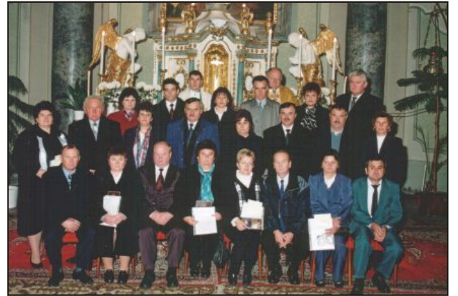
25 éves házassági jubilánsok