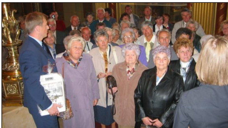
Dr. Gedei József országgyűlési képviselő fogadja a nyugdíjasokat az Országházban

Szeptember 30-án reggel 7 órakor - egy kissé borongós és hűvös napon - Sárospatakra indultunk.